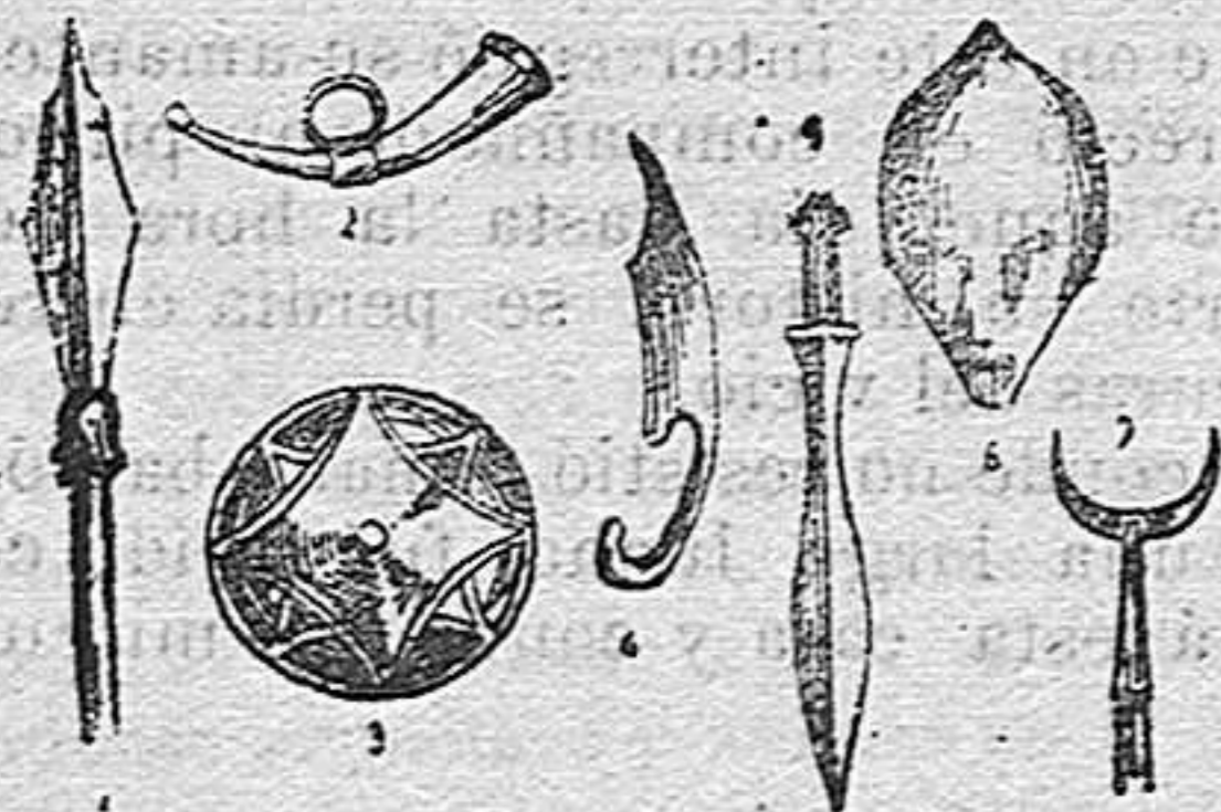
1) parte superior de la lanza asturica. 2) bocina. 3) rodela. 4) hoz-puñal. 5) espada cántabra. 6) casco. 7) vidente.

Entre los variados objetos que aún se conservan en algunos museos, pertenecientes a los tiempos en que cántabros y romanos se batían con fiereza por los montes asturianos, figuran los objetos que representa nuestro dibujo, los cuales dan una idea del adelanto que en la construcción de armas blancas se hallaban los primeros.