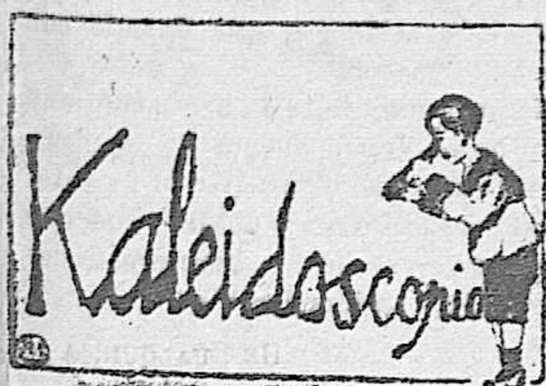
La ley del embudo