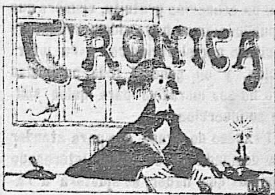
«Jipijapas», y «panamás»

Las observaciones meteorológicas, registradas en el del Instituto en el día son las siguientes: Temperatura máxima, 24.3 sobre cero. Idem mínima, 10.2 sobre cero. Evaporación, 4.8. Retorrido, 96.5. Dirección del viento, E. Fuerza, calma. Cielo, brumoso.