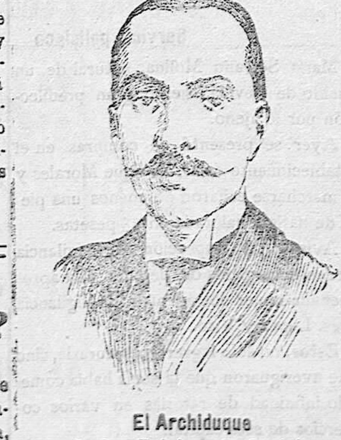
El Archiduque Carlos Esteban de Austria

(DE NUESTRO SERVICIO ESPECIAL) En las recientes entrevistas de los cancilleres de Alemania y de Austria, se ha tratado con gran detenimiento la cuestión polaca. El Consejo de Estado del nuevo reino