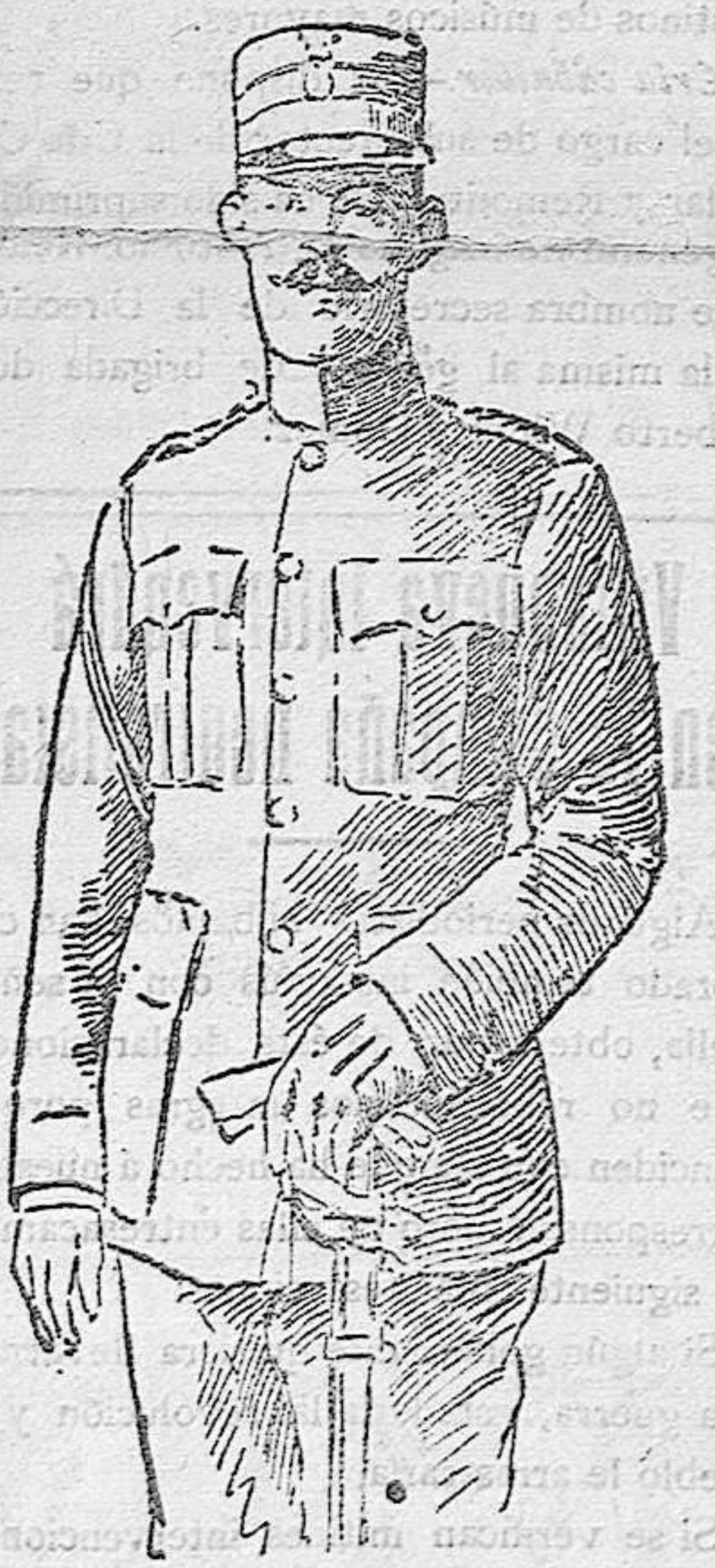
El Rey Constantino de Grecia