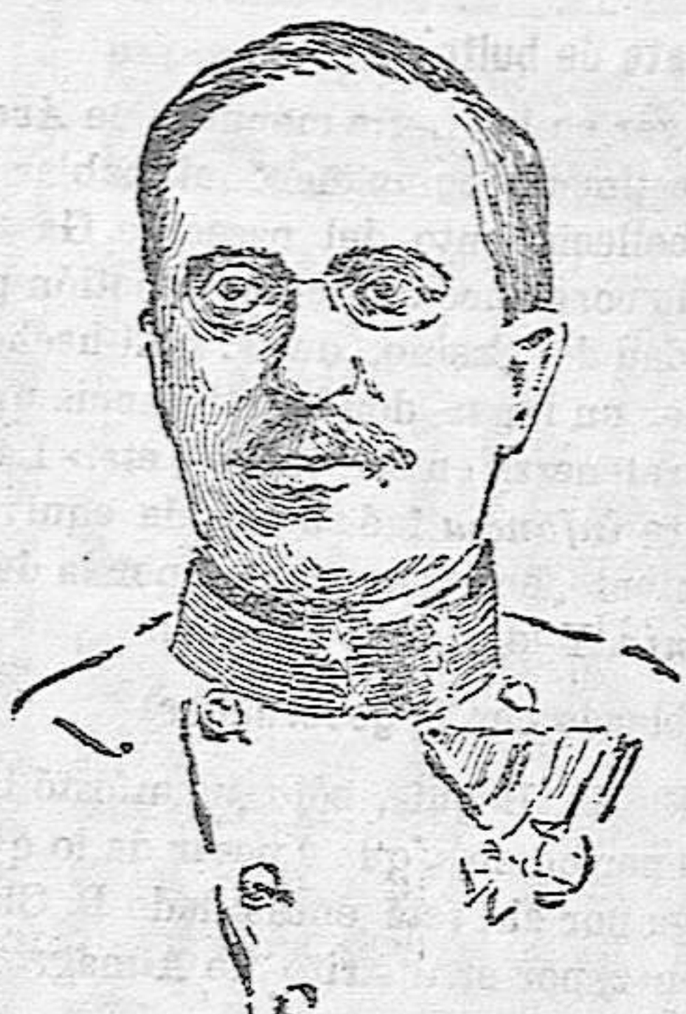
General Arz Stranzemburg, nuevo jefe del Estado Mayor austro-húngaro.