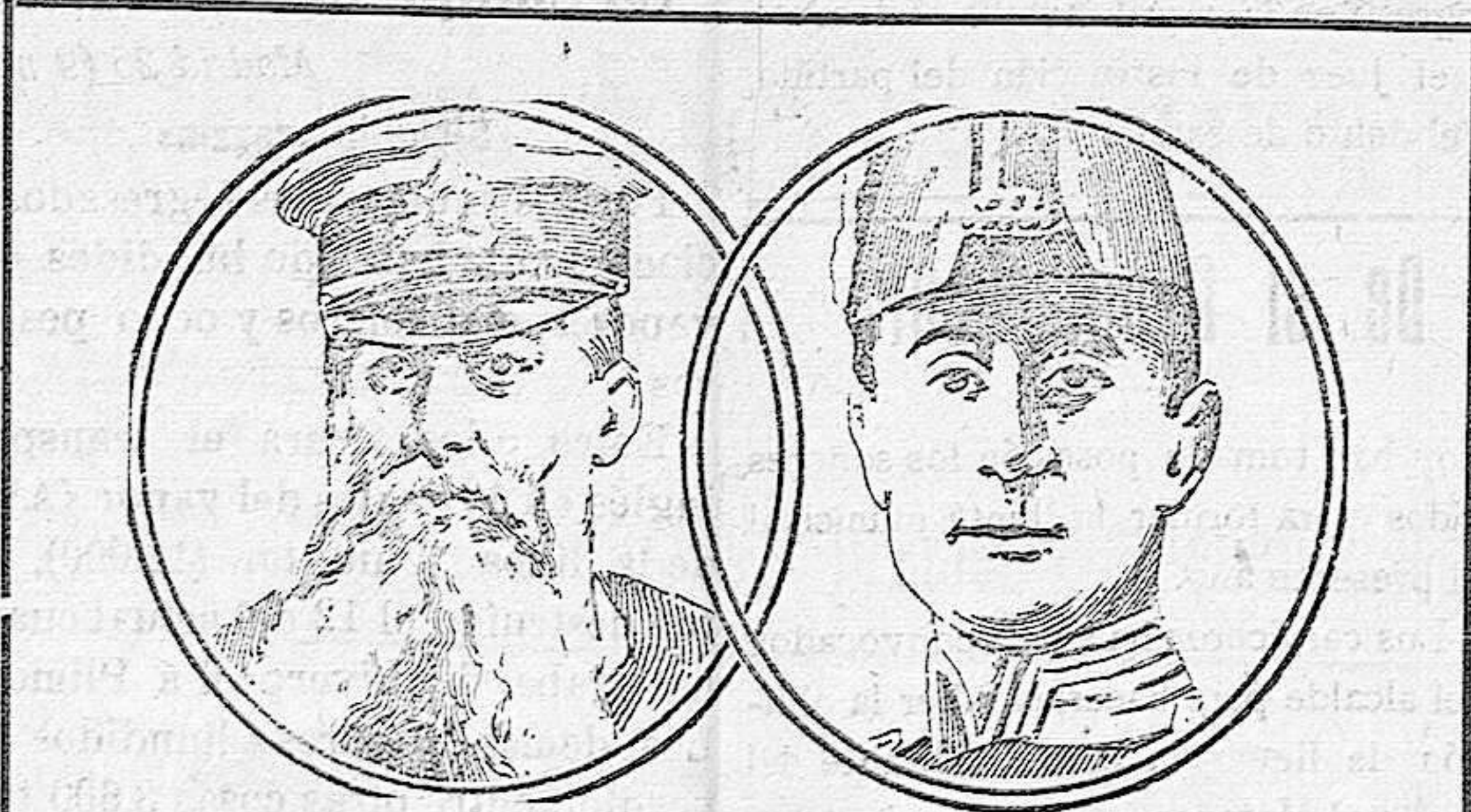
El almirante alemán Von Tirpitz y el almirante inglés Sir John Jellicoe, primer «Sea lord» del almirantazgo.

Pero á esto replican los alemanes que el número de buques hundidos no representa exactamente el efecto principal de la campaña submarina; lo que se persigue ante todo, es intimidar á la