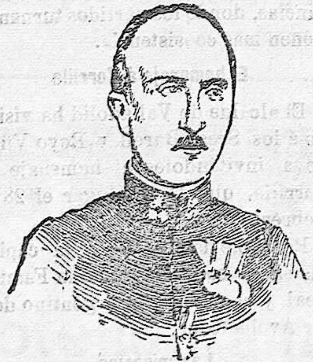
El conde Ciam-Martini, nuevo presidente del Consejo de ministros de Austria.