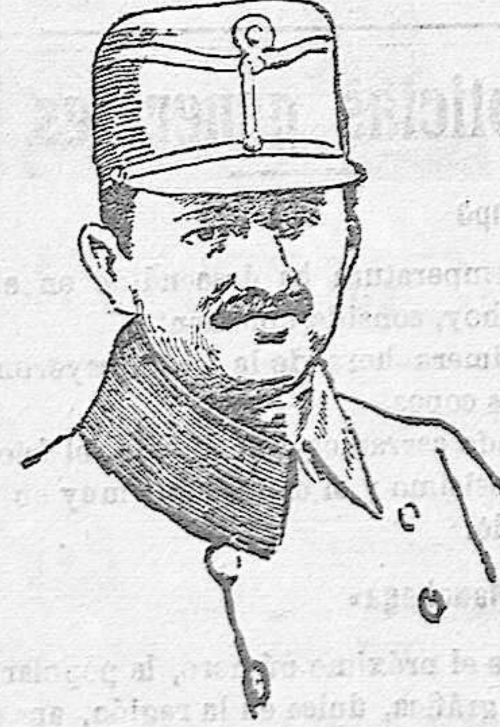
Uno de los últimos retratos del nuevo emperador Carlos de Austria.

Los trajes medioevales de los magnates, los uniformes de riquísimos brocados de los miembros del Parlamento daban á la comitiva del monarca un brillo extraordinario. La coronación fué precedida de solemnes actos de homenaje, de los diputados de la Corte, de los Parlamentarios y de los delegados de las ciudades del reino; luego en la catedral de Buda, el cardinal primado y el conde Tisza, éste en calidad de delegado palatino, colocó sobre la cabeza del rey la histórica corona de San Esteban, obra valiosísima por su arte admirable y por la cantidad de piedras preciosas que la adornan.