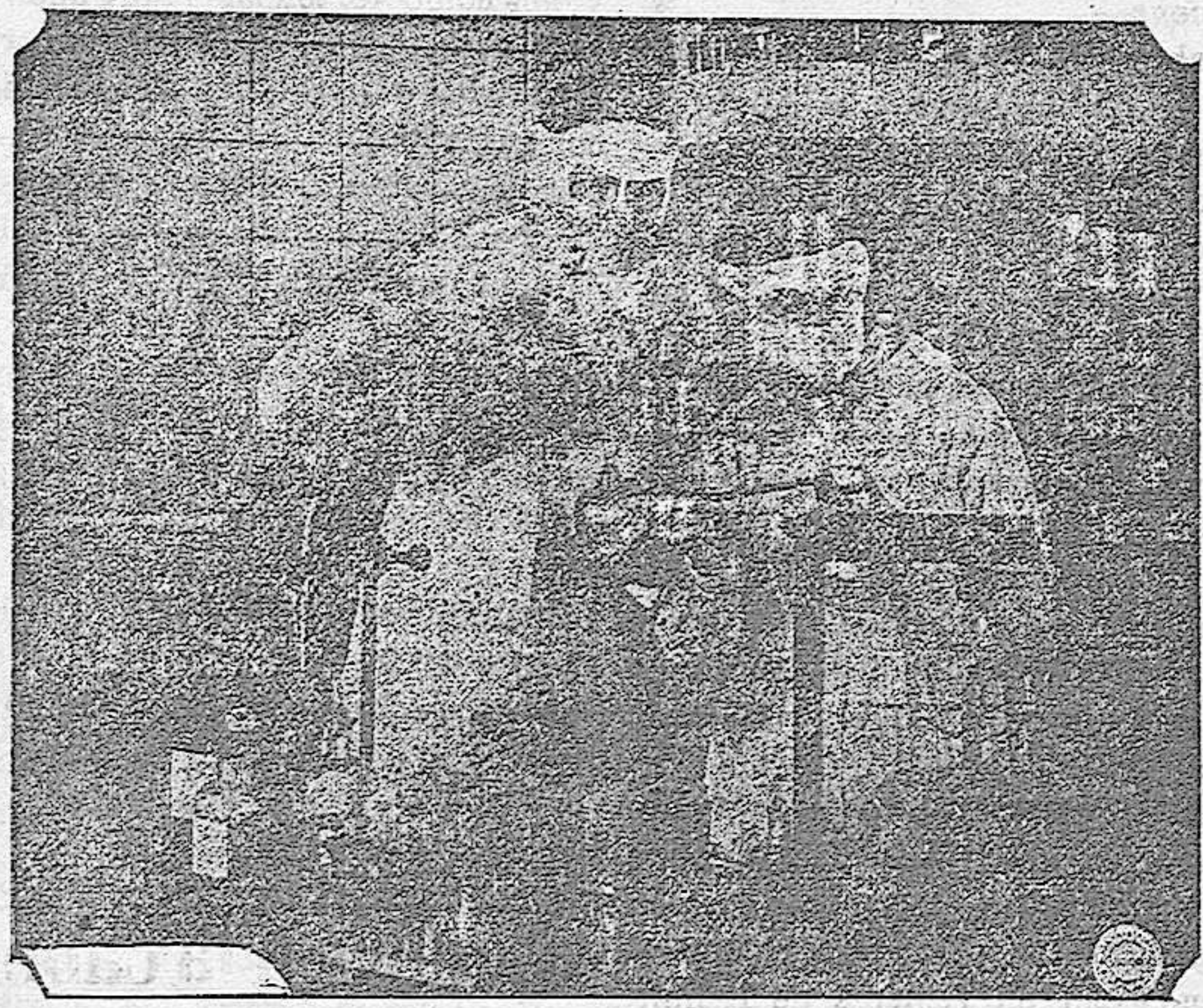
Escena de la emocionante película LOS VAMPIROS, que se estrenará el domingo en el Teatro-Circo.

Se abre un concurso para dotar de casa de Correos á la estación de Puerto-llano.