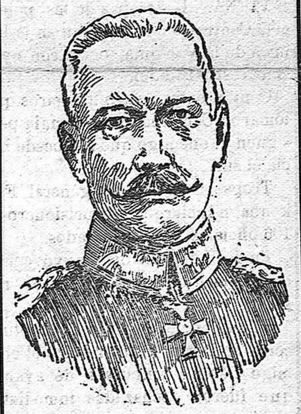
El general Erich von Falkenhayn, que se ha encargado del mando del ejército austro-alemán de la Transilvania para contestar á la ofensiva rumano-rusa.