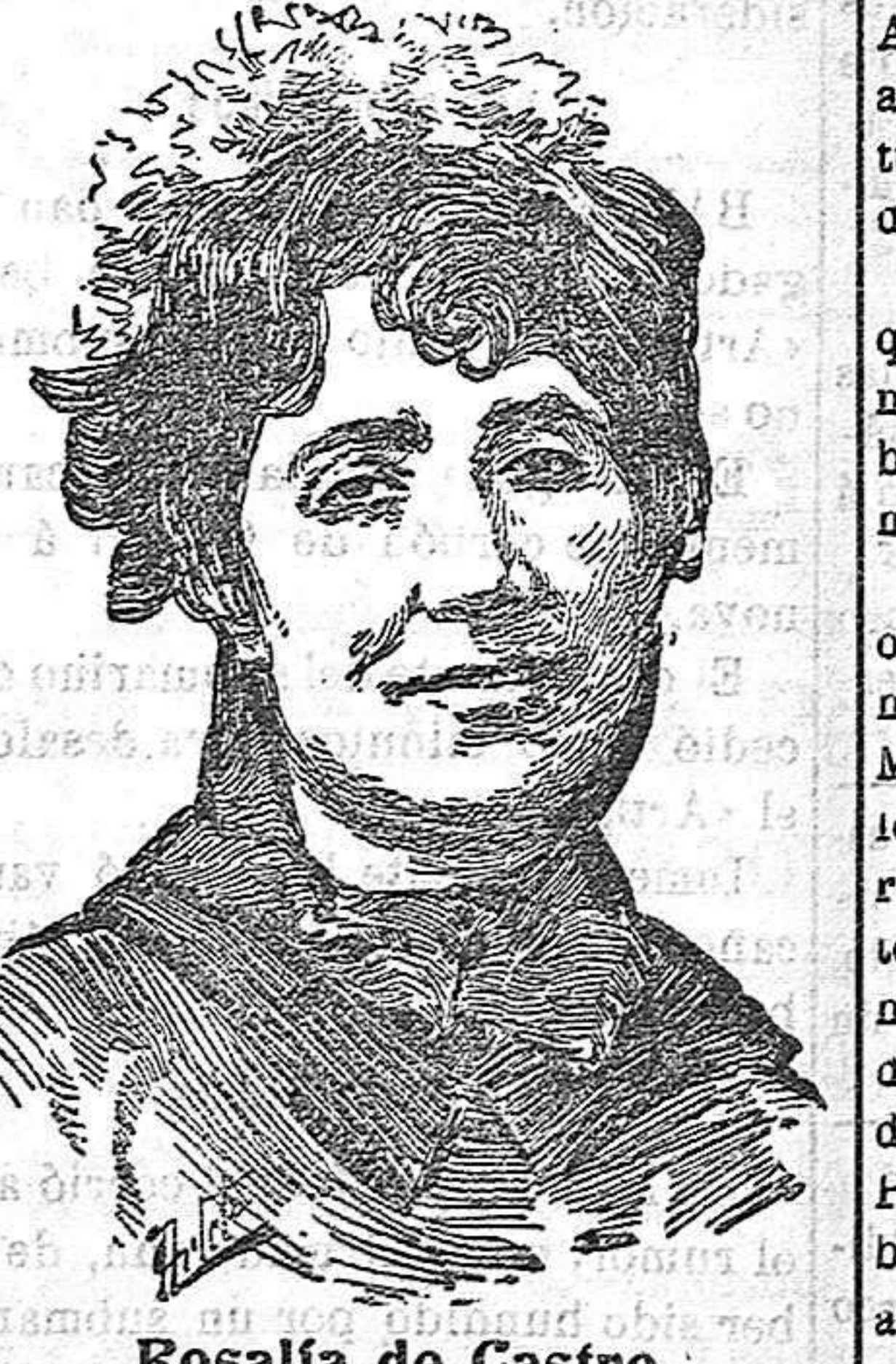
Rosalía de Castro