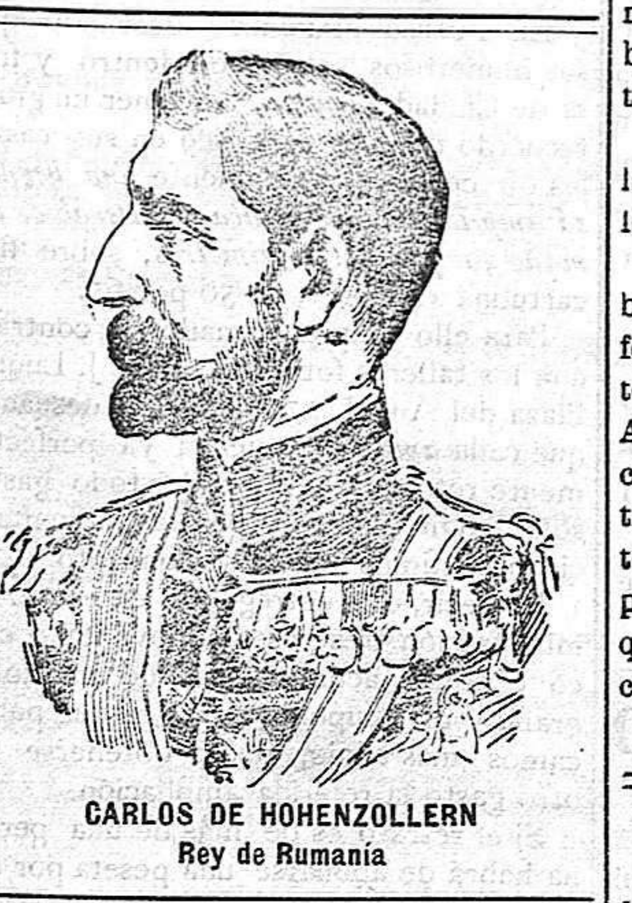
CARLOS DE HOHENZOLLERN Rey de Rumania

EL PUEBLO MANCHEGO se vende en Madrid en el kiosco de El Debate, calle de Alcalá, frente á las Calatruvas.