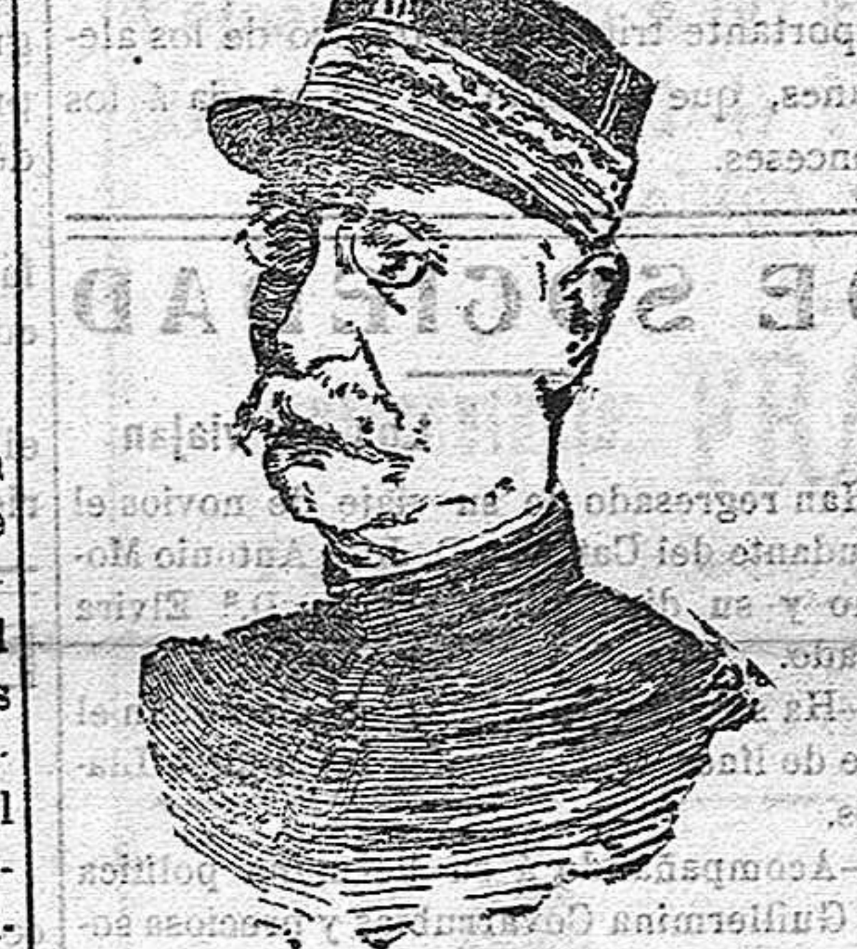
LA ENSEÑANZA OFICIAL