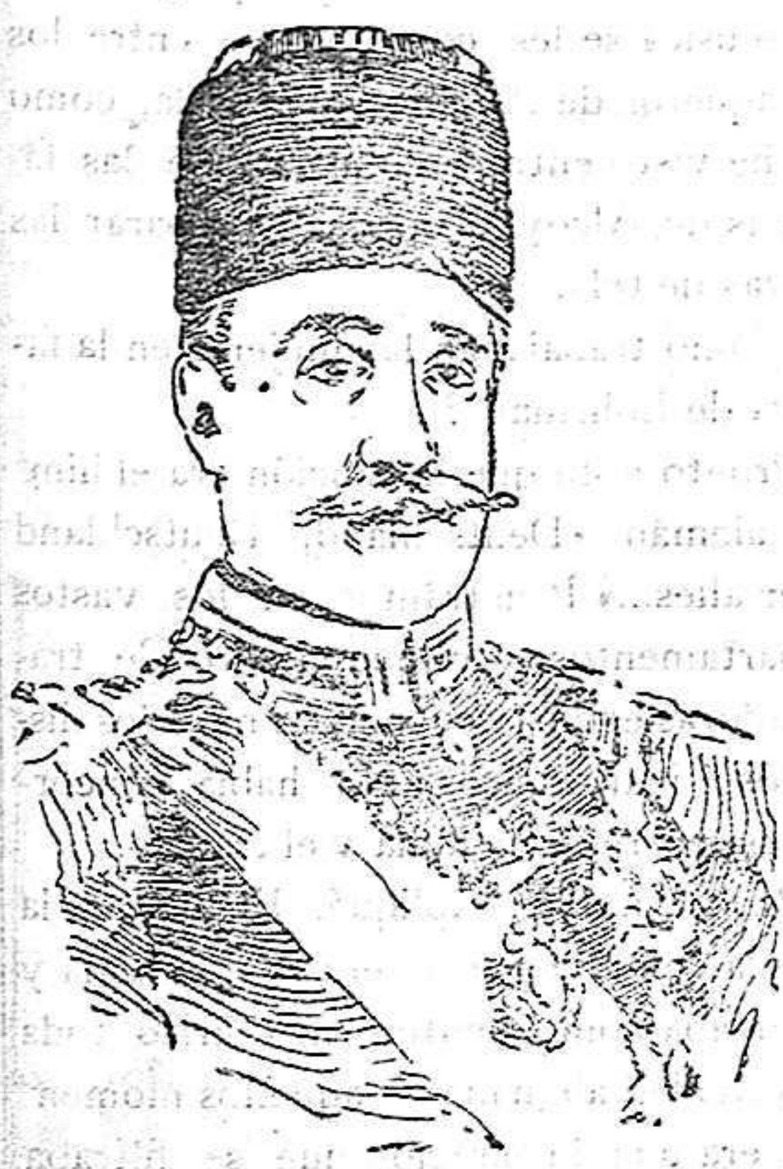
El príncipe Ysuss Yzaddin que se ha suicidado en su propio palacio, seccionándose las arterias.