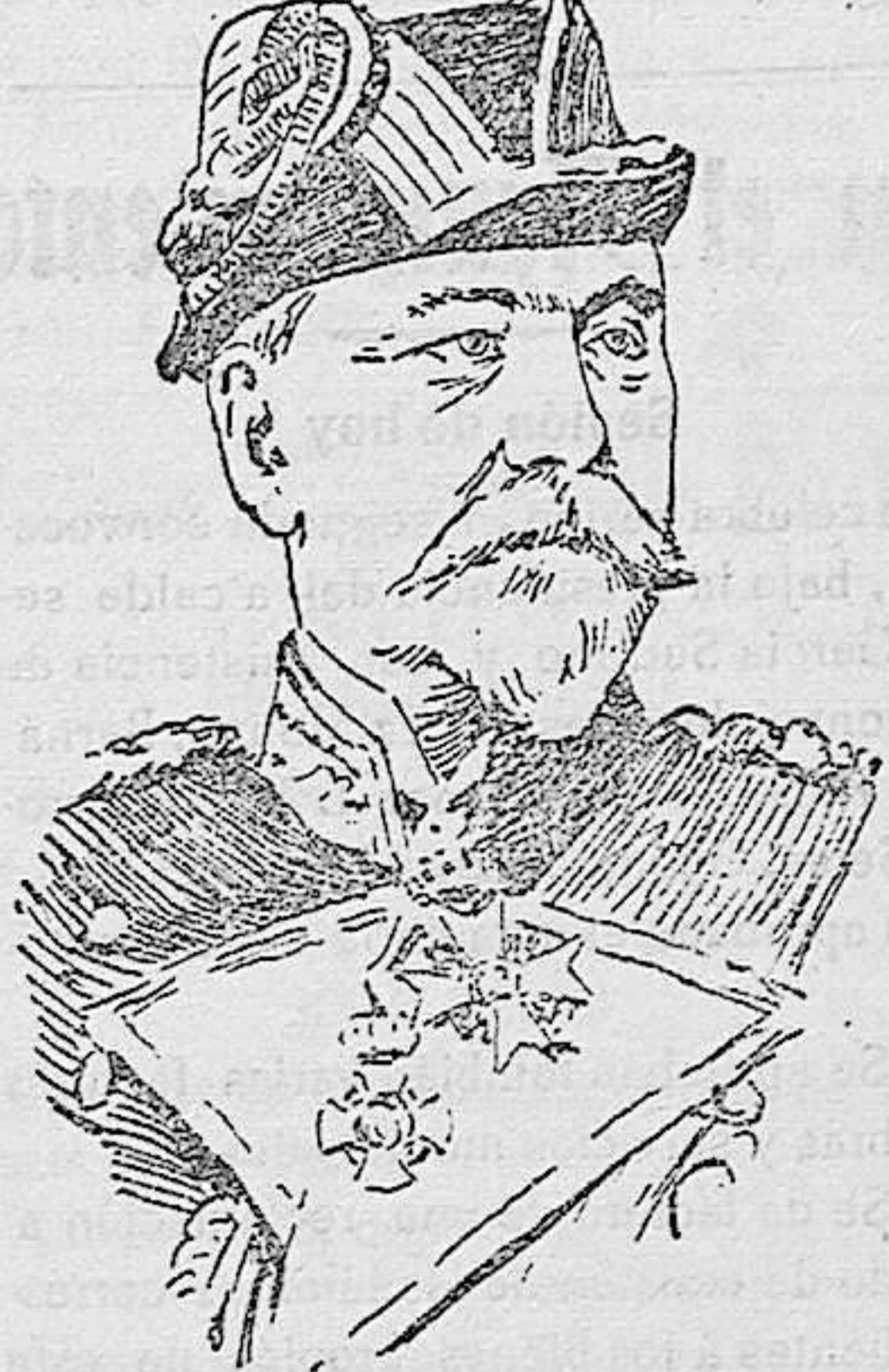
EL GRAN ALMIRANTE VON KSTER DE MARINA ALEMANA