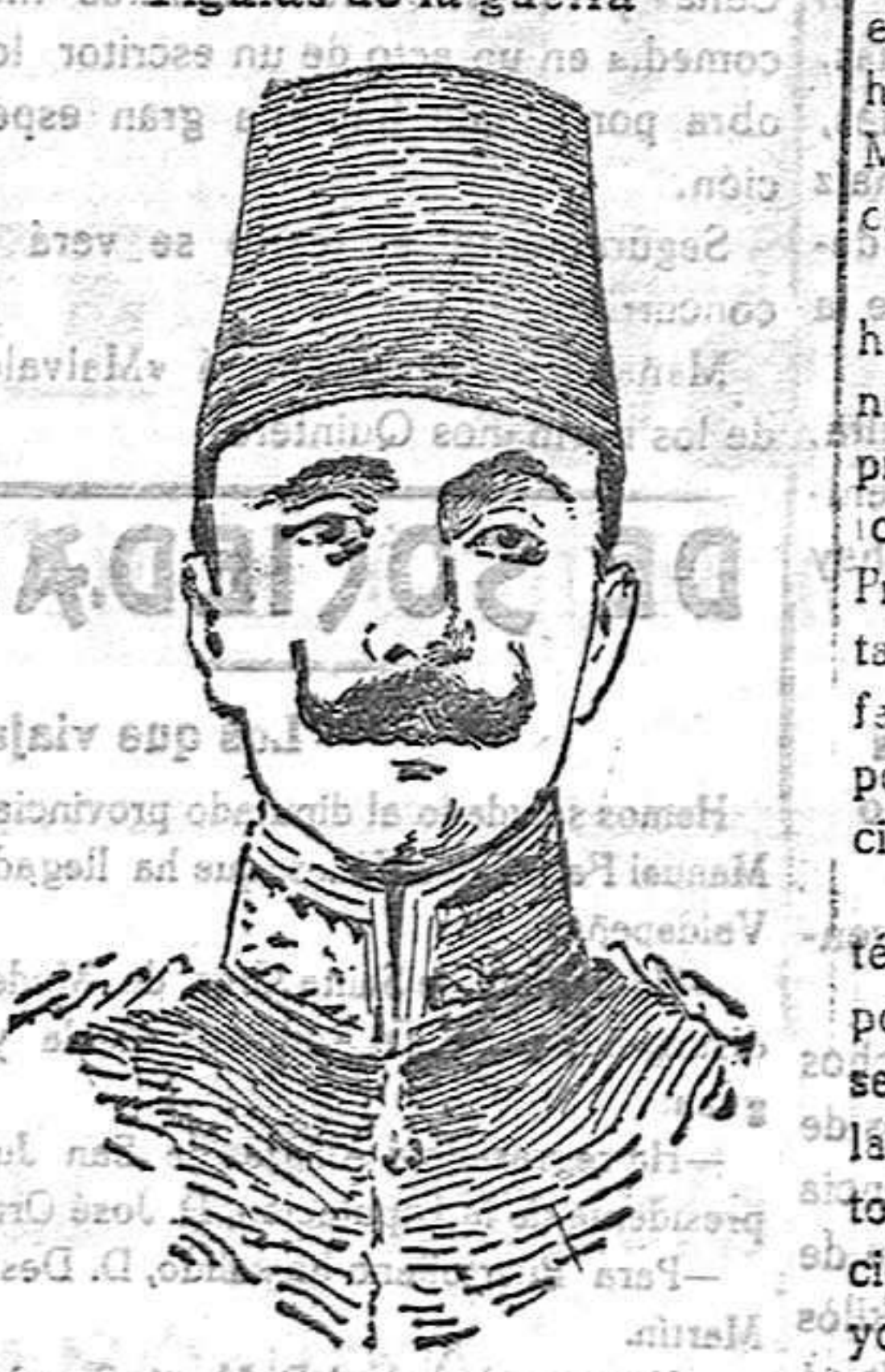
MINISTRO DE LA GUERRA DE TURQUÍA Y JEFE DEL PARTIDO "JOVENES TURCOS"