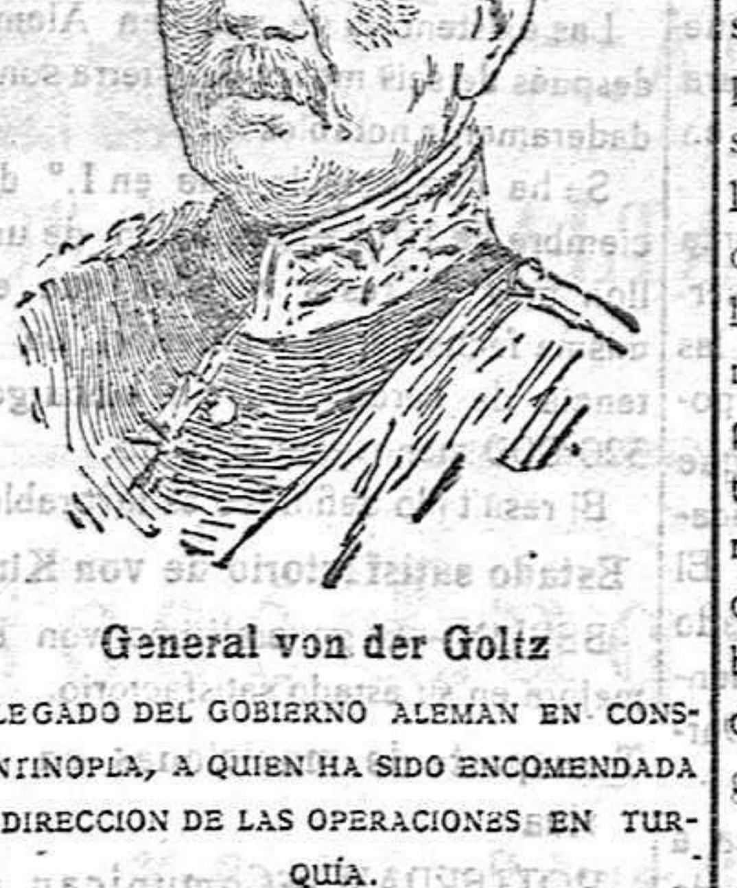
General von der Golz

DELEGADO DEL GOBIERNO ALEMÁN EN CONSTANTINOPOLA, A QUIEN HA SIDO ENCOMENDADA LA DIRECCION DE LAS OPERACIONES EN TURQUIA.