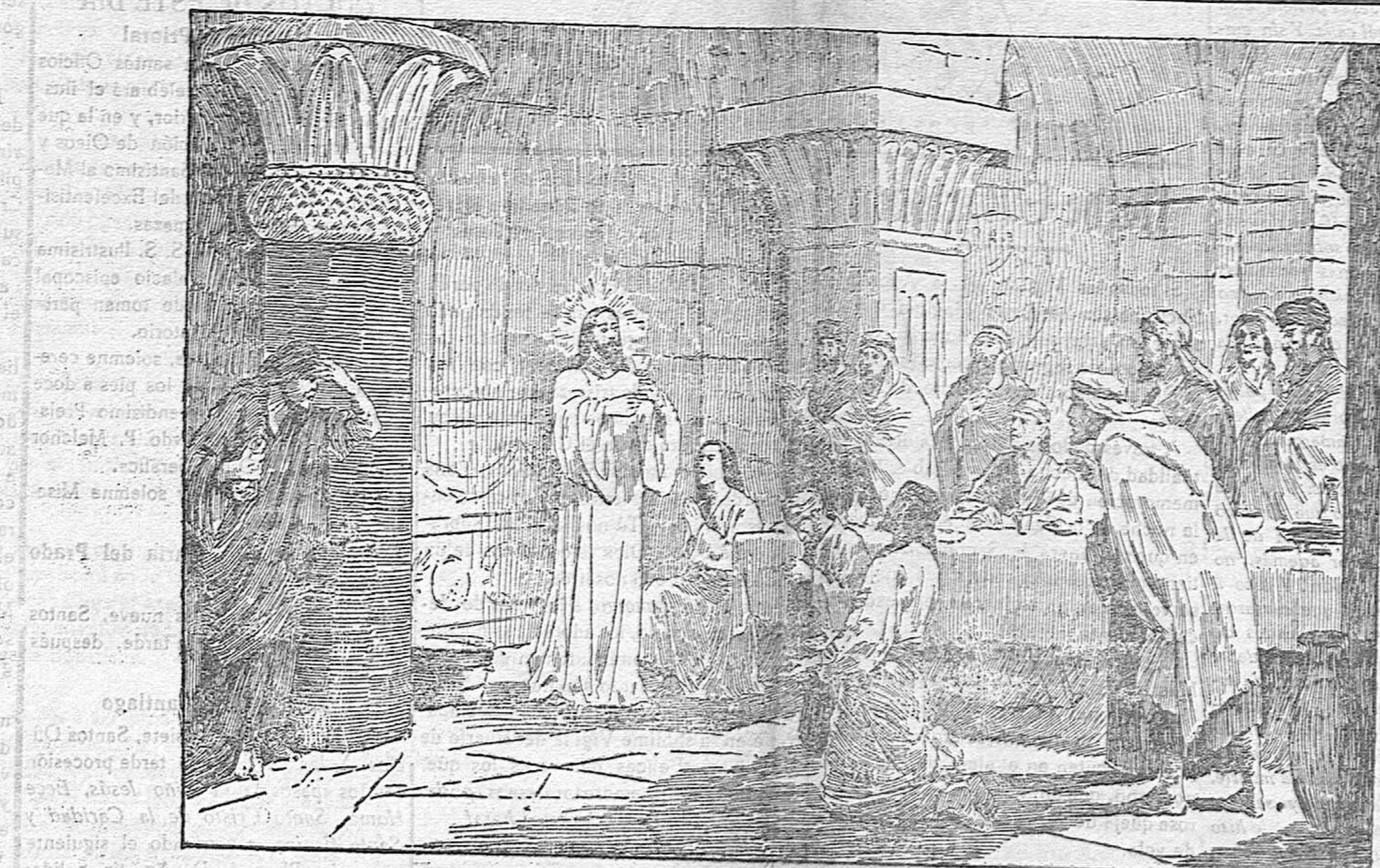
INSTITUCIÓN DE LA SAGRADA EUCHARISTÍA

Quien por sus enemigos suspirando Pide perdón, mejor en tal desseo Mostró ser Dios que el sol y mar bra (mando), FRANCISCO DE QUEVEDO VILLEGAS.