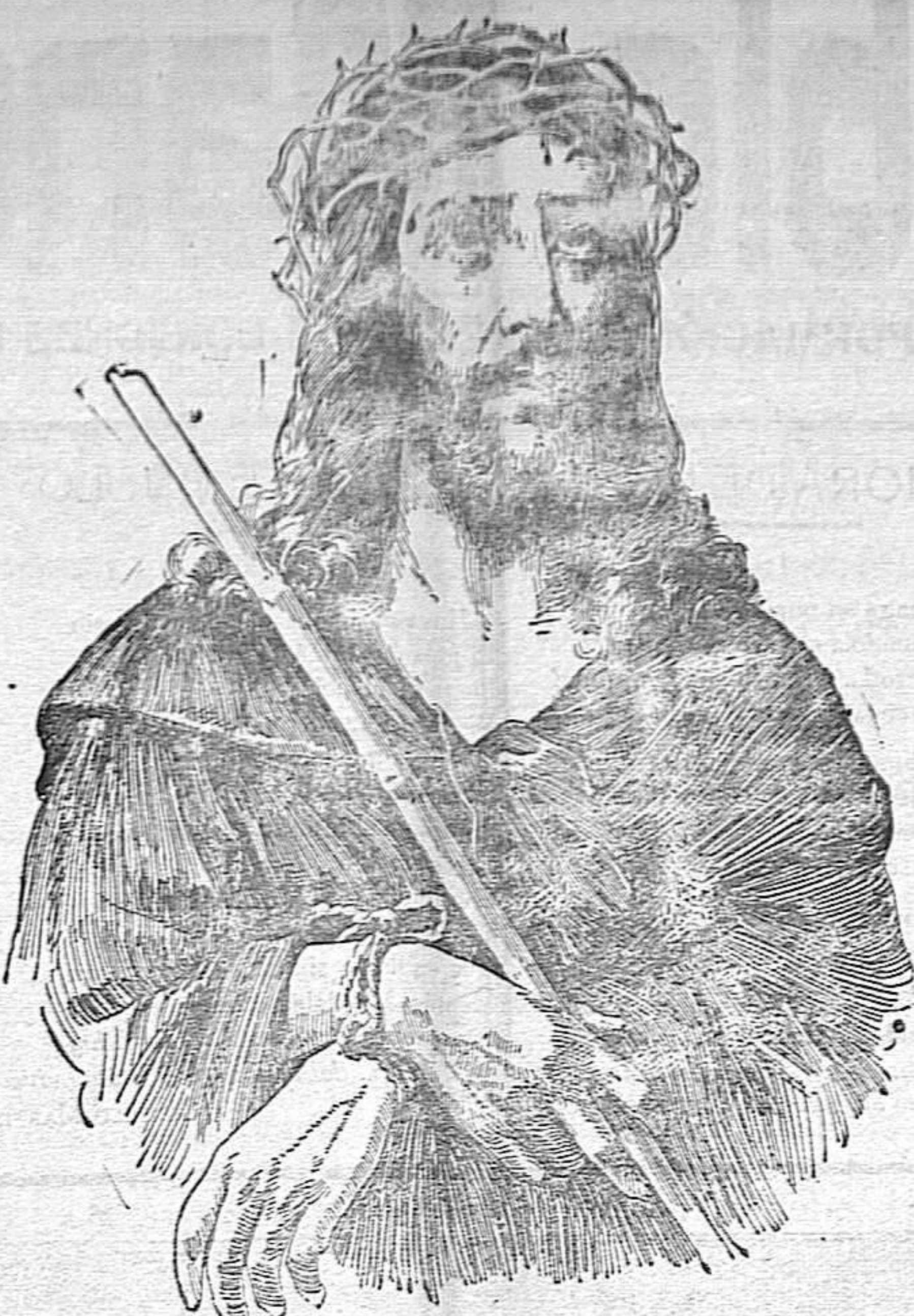
ECCE-HOMO Cuadro de Crosi.