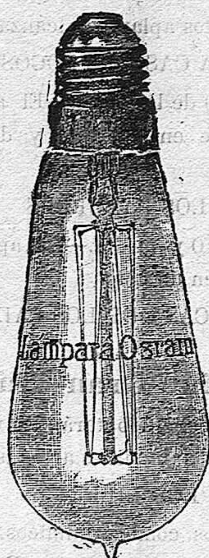
Exijase la marca OSRAM grabada en el cristal