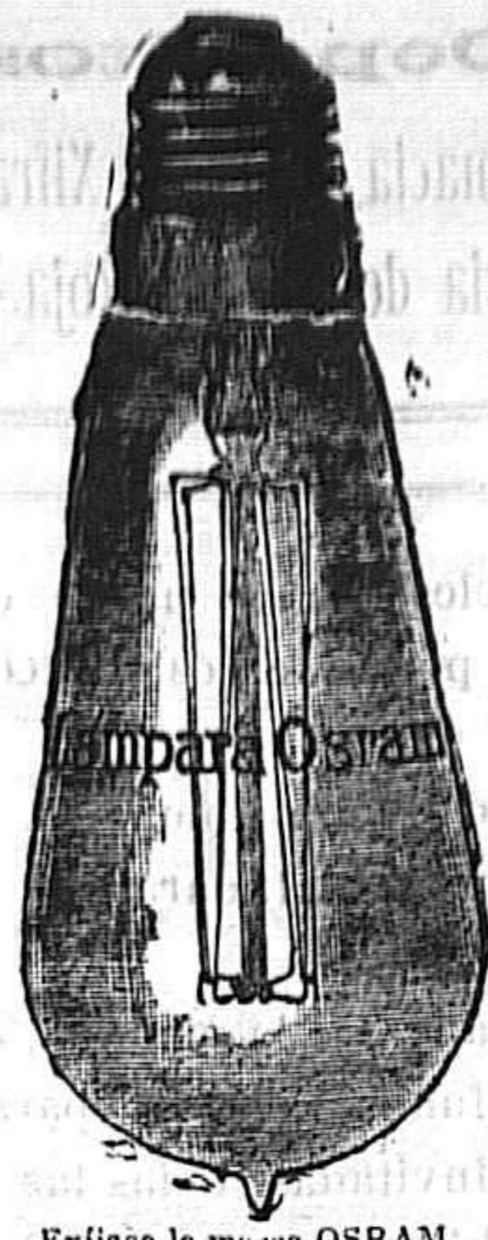
Exijase la marca OSRAM grabada en el cristal