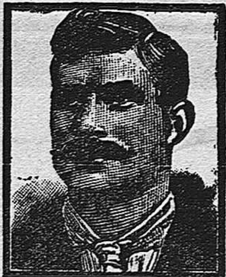
Tarrasa, Calle Media Pasa 64, 3 Marzo 1909.

Pídanse los legítimos Compridos Vichy-Etat, en frascos, y las auténticas Pastillas Vichy-Etat, en cajitas metálicas. Deséchense las imitaciones. Exíjase Vichy-Etat.