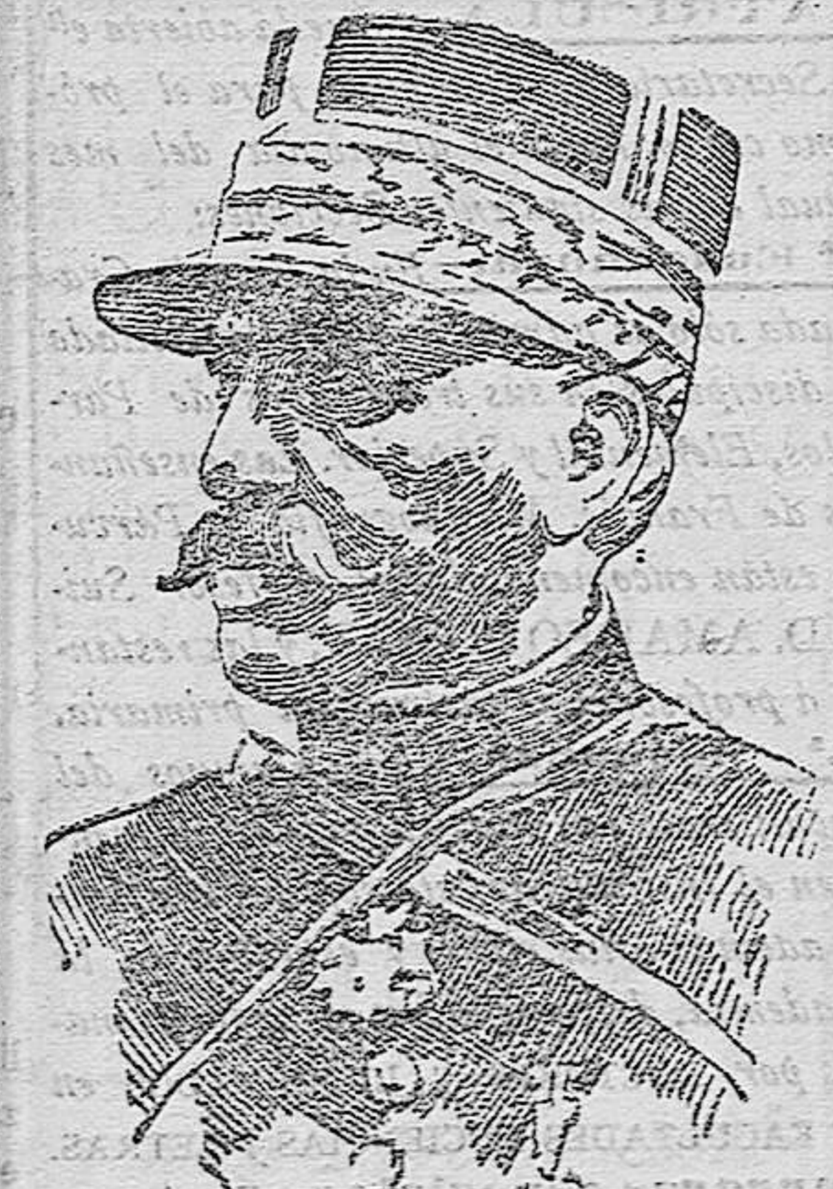
El general Castellan

Relacionando el esfuerzo de Austria hacia lo cabo en Polonia, prestando fundaria atención a las operaciones por Prusia oriental, después de los setos reverses sufridos por los rusos en su fracasado intento de invasión, se pone de manifiesto un plan verosímil de operaciones contra Rusia, cuya finalidad serían: la plaza fuerte de Bjelostok y el campo atrincherado de Brest-Sitovk, que constituyen la principal base de operaciones de Rusia occidental.