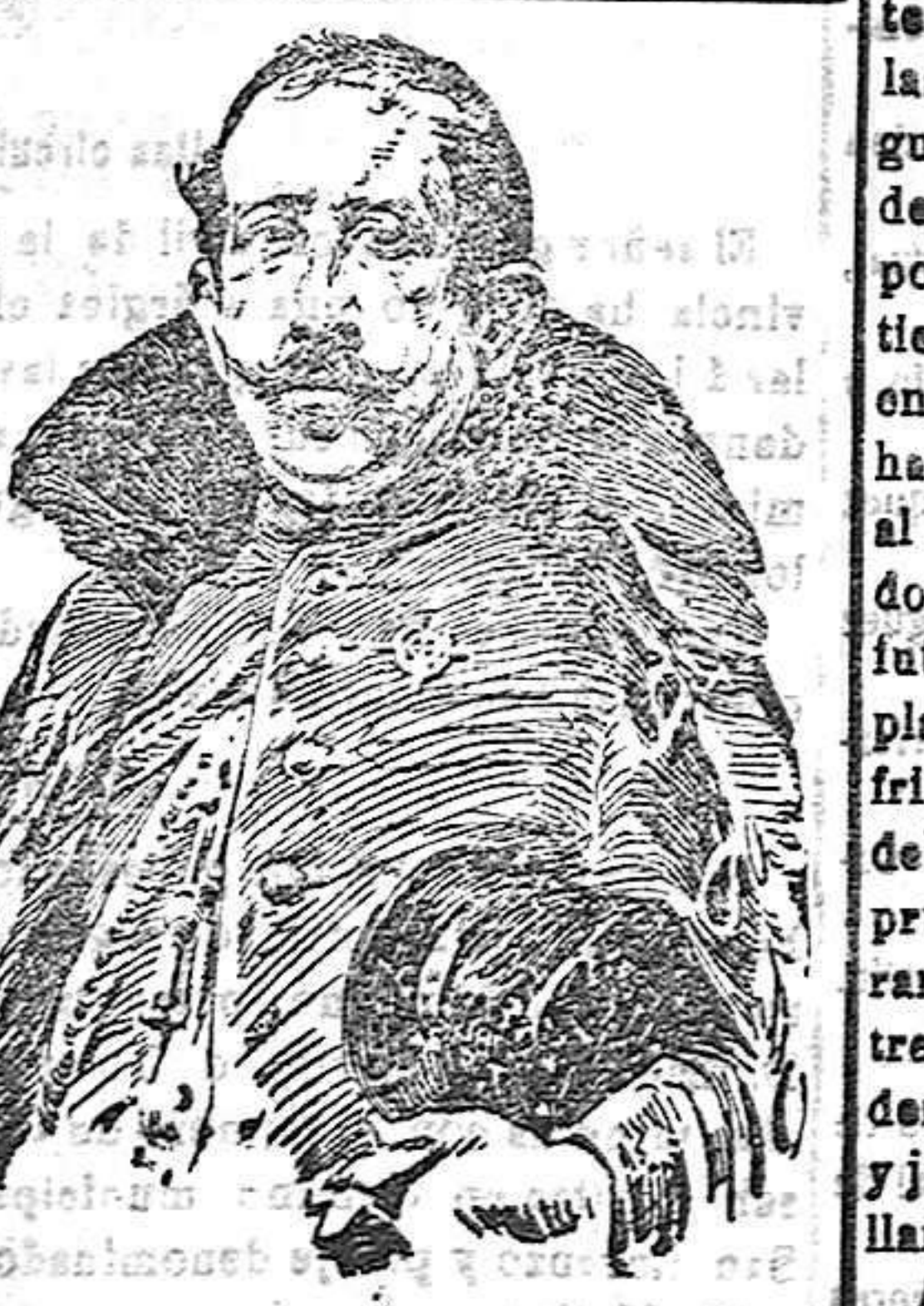
El general Burguete RELEVADO DE SU CARGO AL FRENTE DE LAS FUERZAS DE CAZADORES EN MELILLA