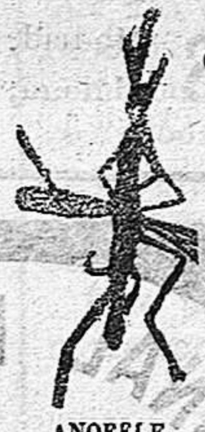
ESANOFELE Mosquito que propaga la fiebre palúdica.

Rogamos a los Sres. Doctores que lo ensayen en los casos que resultaren incurables con cualquier otro tratamiento, con la seguridad de que después no lo abandonarán nunca.