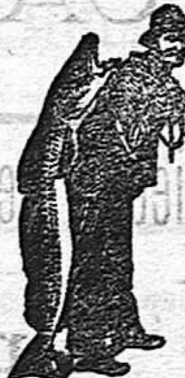
¡ Obténgase siempre la Emulsión con esta marca "El Pescador" marca del procedimiento Scott!