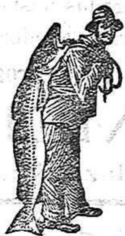
Obténase siempre la Emulsión con esta marca "El Pescador", marca del procedimiento Scott.

El intenso poder nutritivo de la Emulsión SCOTT, que salvó a este niño, solo se puede mantener escogiendo continuamente los materiales mas finos y preparándolos por el procedimiento científico de SCOTT, que deja todo el alimento en una forma fácil de digerir por el estómago mas delicado. Ninguna otra emulsión más que la de SCOTT, ofrece estas ventajas, y por eso, si quiere V. salvar a su nene (como lo salvó el Sr. Arellano) debe V. pedir la emulsión del "pescador y el pescado" en el envoltorio,