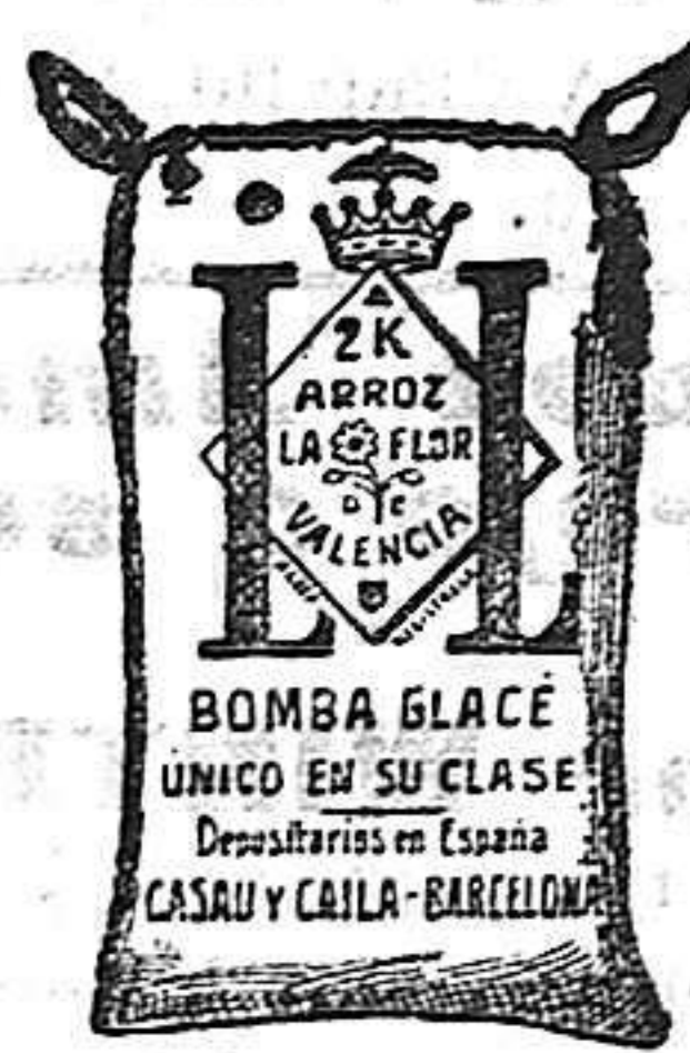
Arroz Glacé (2 Kilos)