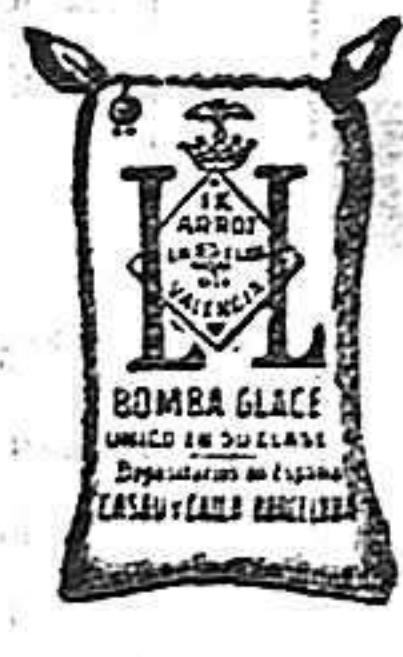
Arroz Glacé (1 Kilo)