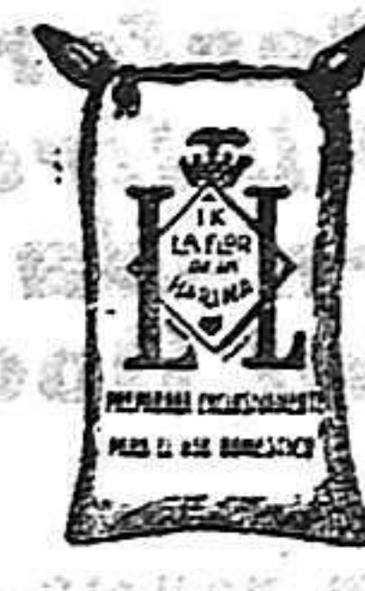
Harina frappa (1 Kilo)