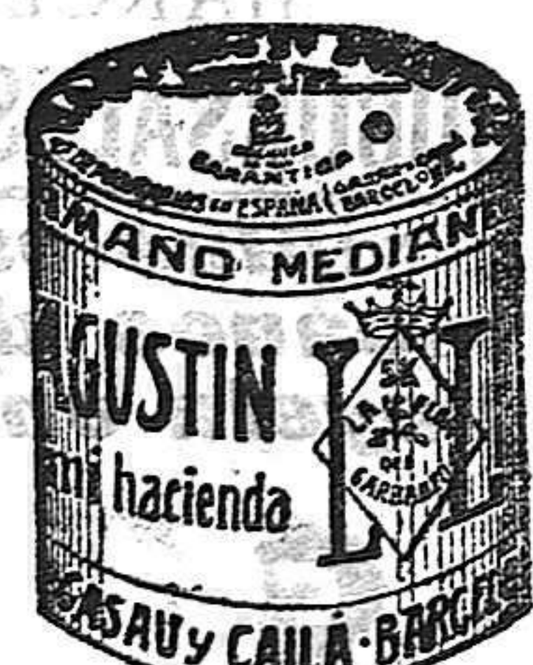
Garbanzo Saucó (5 Kilos)

Garantizamos al público que los comestibles empaquetados con nuestra marca son naturales de la planta, y sin contener la más pequeña adulteración en beneficio de ellos ni para hermosearlos, por lo cual nos hacemos responsables á todo análisis que quiera efectuarse.