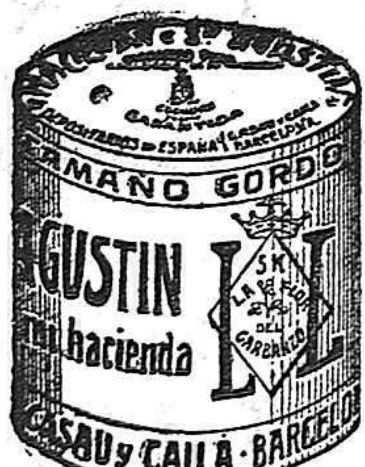
Garbanzo Saucó (5 Kilos)

Las esquelas mortuorias para insertarlas en LA LUCHA se admiten hasta las 3 de la tarde las de la 1.ª página y las de la 2.ª y 3.ª hasta las 5.