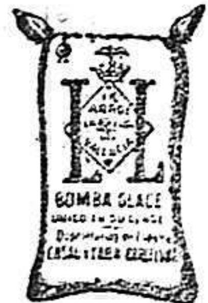
Arroz Glacé (1 Kilo)