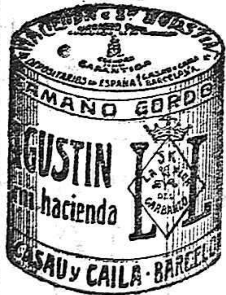
Garbanzo Sauco (5 Kilos)

Las esquelas mortuorias para insertarlas en LA LUCHA se admiten hasta las 3 de la tarde las de la 1.ª página y las de la 2.ª y 3.ª hasta las 5.