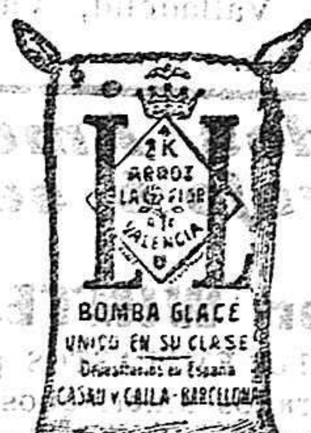
Arroz Glacé (2 Kilos)