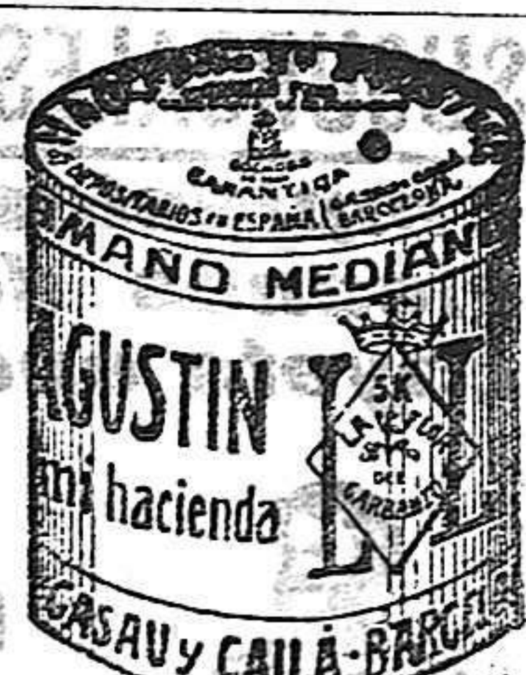
Garbanzo Sauco (5 Kilos)

Garantizamos al público que los comestibles empaquetados con nuestra marca son naturales de la planta, y sin contener la más pequeña adulteración en beneficio de ellos ni para hermosearlos, por lo cual nos hacemos responsables á todo análisis que quiera efectuarse.