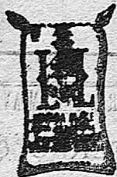
Arroz Glacé (1 kilo)