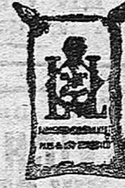
Harina fragada (1 kilo)