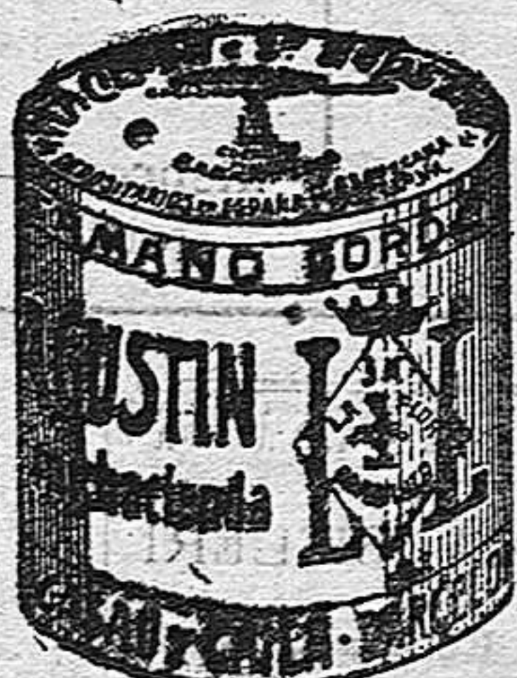
Garbanzo Sauce (3 Kilos)