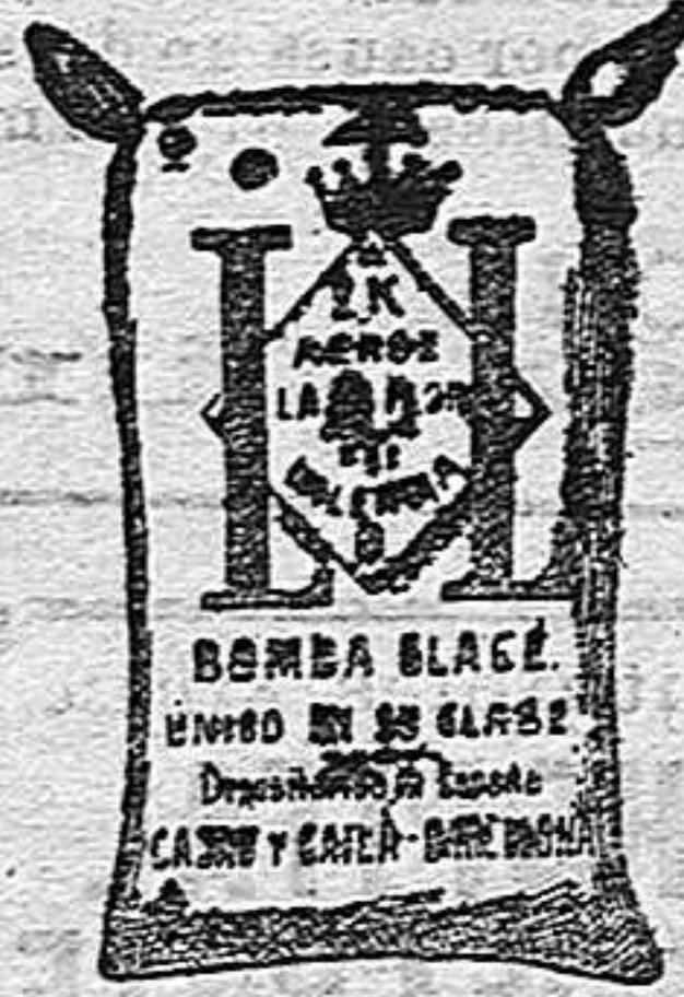
Arroz Glacé (2 Kilos)