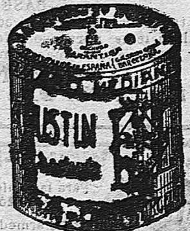
Garbanzo Sauce (5 kilos)

Garantizamos al público que los comestibles empaquetados con nuestra marca son naturales de la planta, y sin contener la más pequeña adulteración en beneficio de ellos ni para hermosearlos, por lo cual nos hacemos responsables á todo análisis que quiera efectuarse.