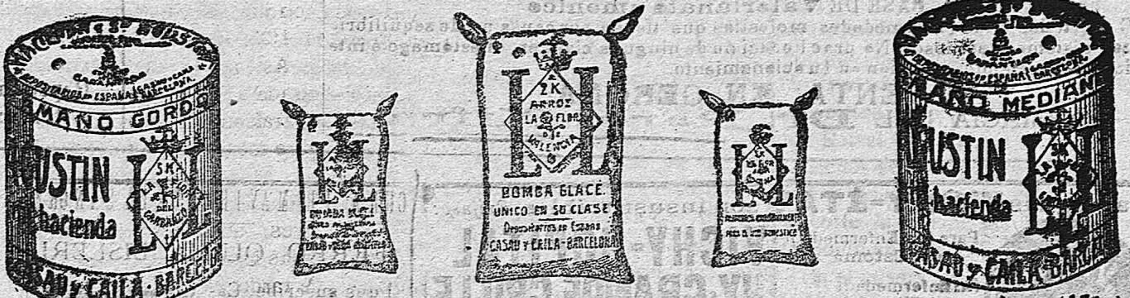
Garbanzo Saucedo (1.5 Kilos) Arroz Glacé (1 kilo) Arroz Glacé (2 Kilos) Harina Trappe (1 kilo) Garbanzo Saucedo (5 Kilos)

Garantizamos al público que los comestibles empaquetados con nuestra marca son naturales de la planta, y sin contener la más pequeña adulteración en beneficio de ellos ni para hermostrarlos, por lo cual nos hacemos responsables á todo análisis que quiera efectuarse.