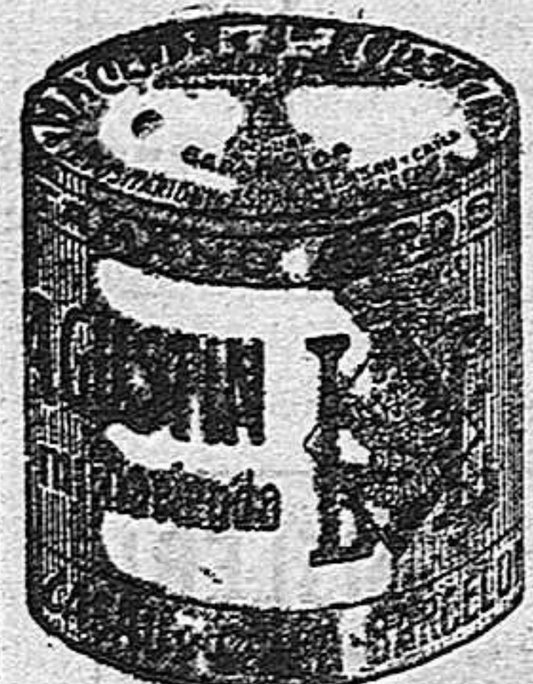
Garbanzo Sauco (5 Kilos)