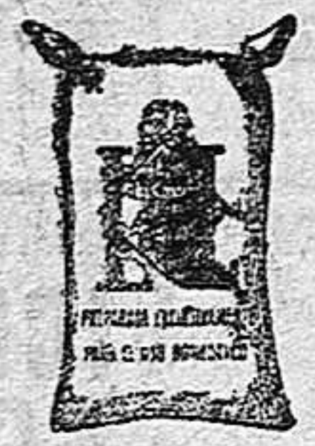
Harina frappe (1 kilo)