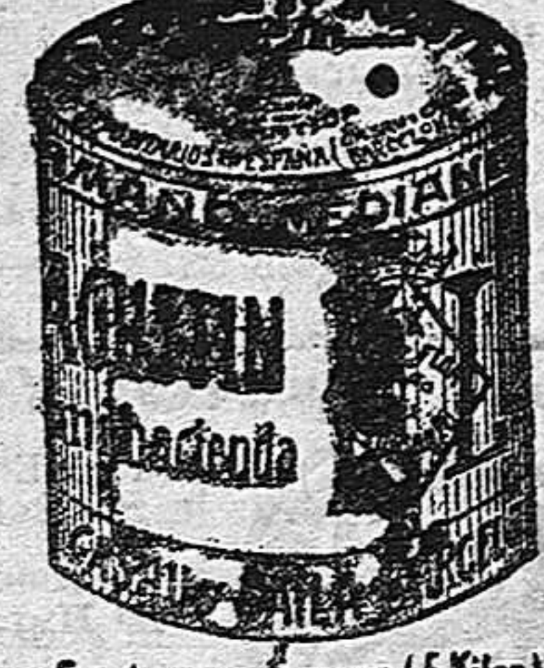
Garbanzo Sauco (5 kilos)

Garantizamos al público que los comestibles empacados con nuestra marca son naturales de la planta, y sin contener la más pequeña adulteración en beneficio de ellos ni para hermosearlos, por lo cual nos hacemos responsables a todo análisis que quiera efectuarse.