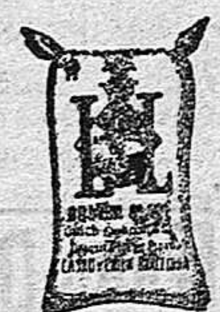
Arroz Glacé (1 kilo)