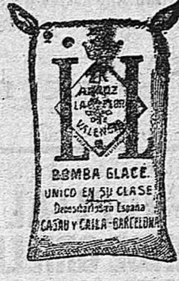
Arroz Glacé (2 kilos)