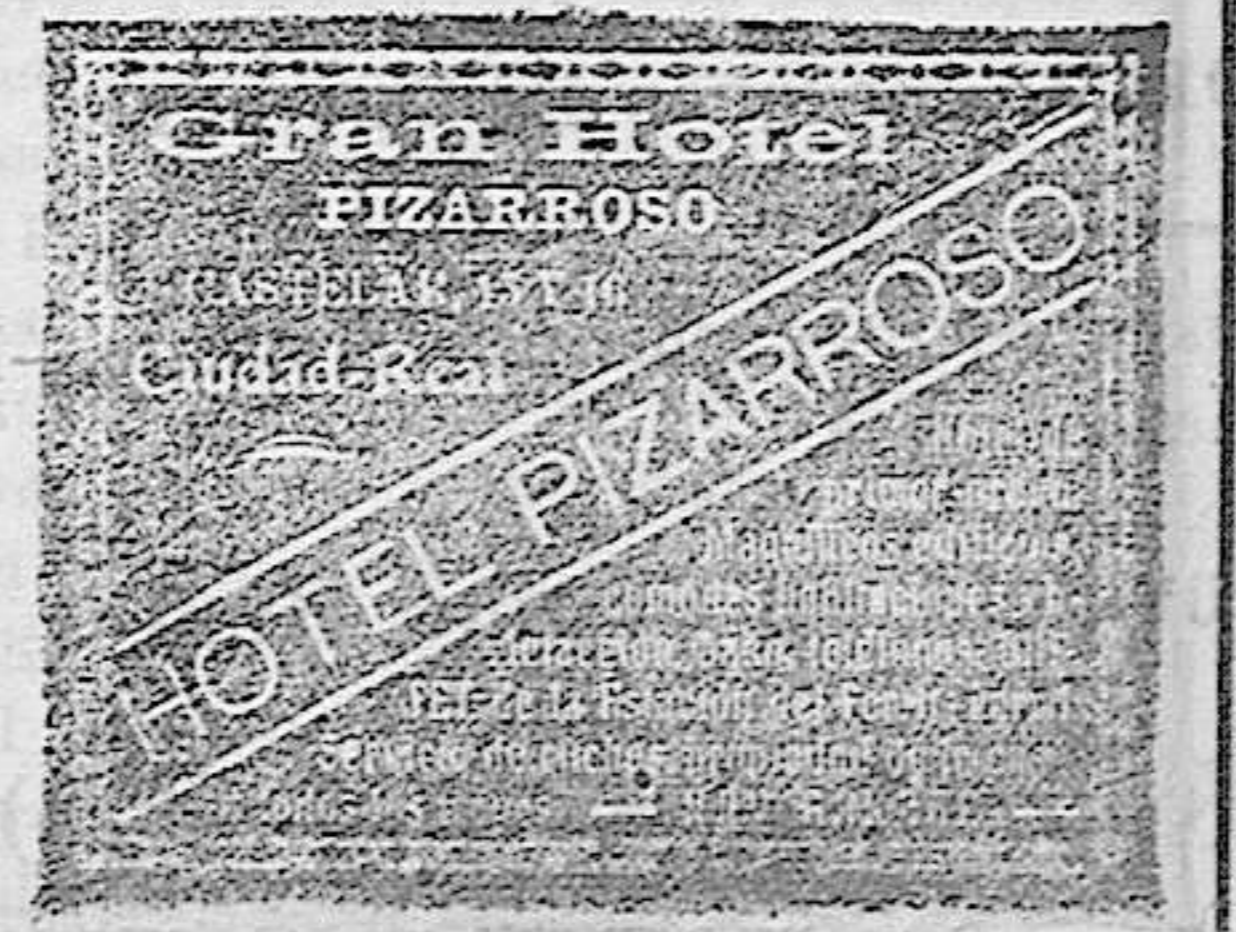
IMPRESA DE EL PUEBLO MANCHEGO

Una era de emparvar, extramuros de dicha villa y á la derecha del camino de Carrión.