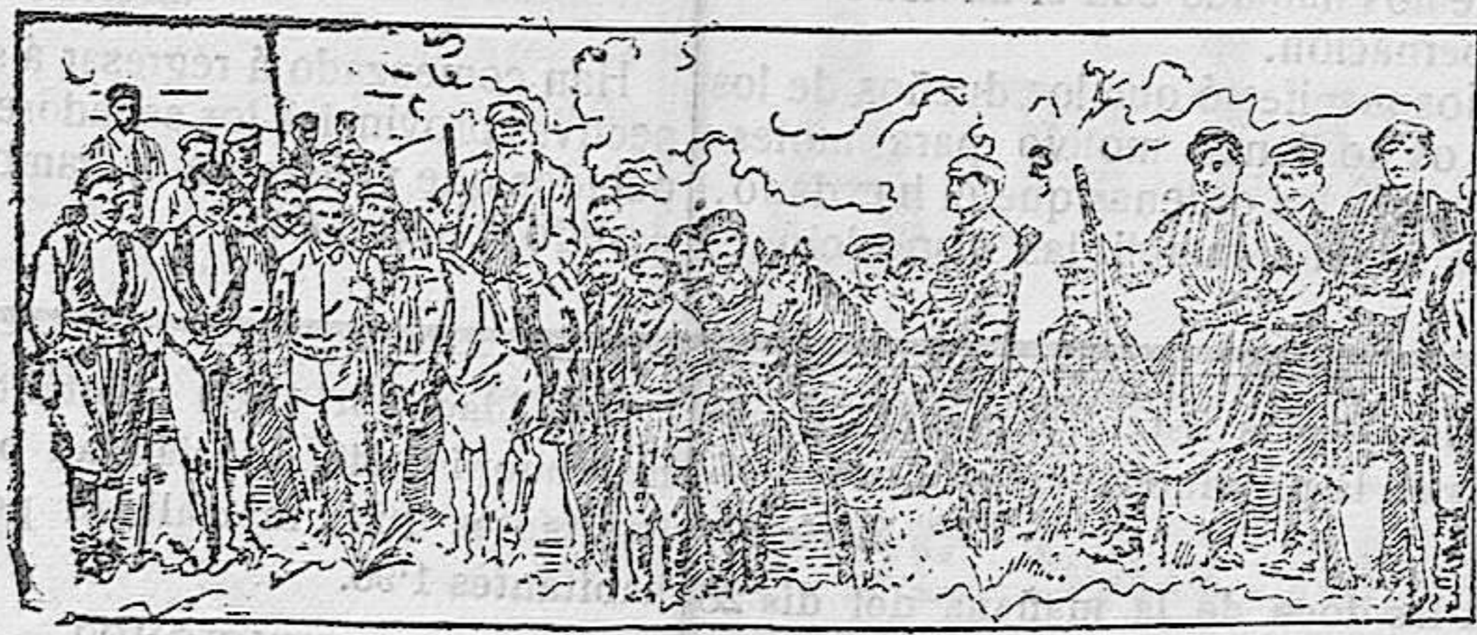
CUADRILLA DE VOLUNTARIOS CRETENSES QUE PELEA CONTRA LOS TURCOS EN EL VILAGETO DE JANINA