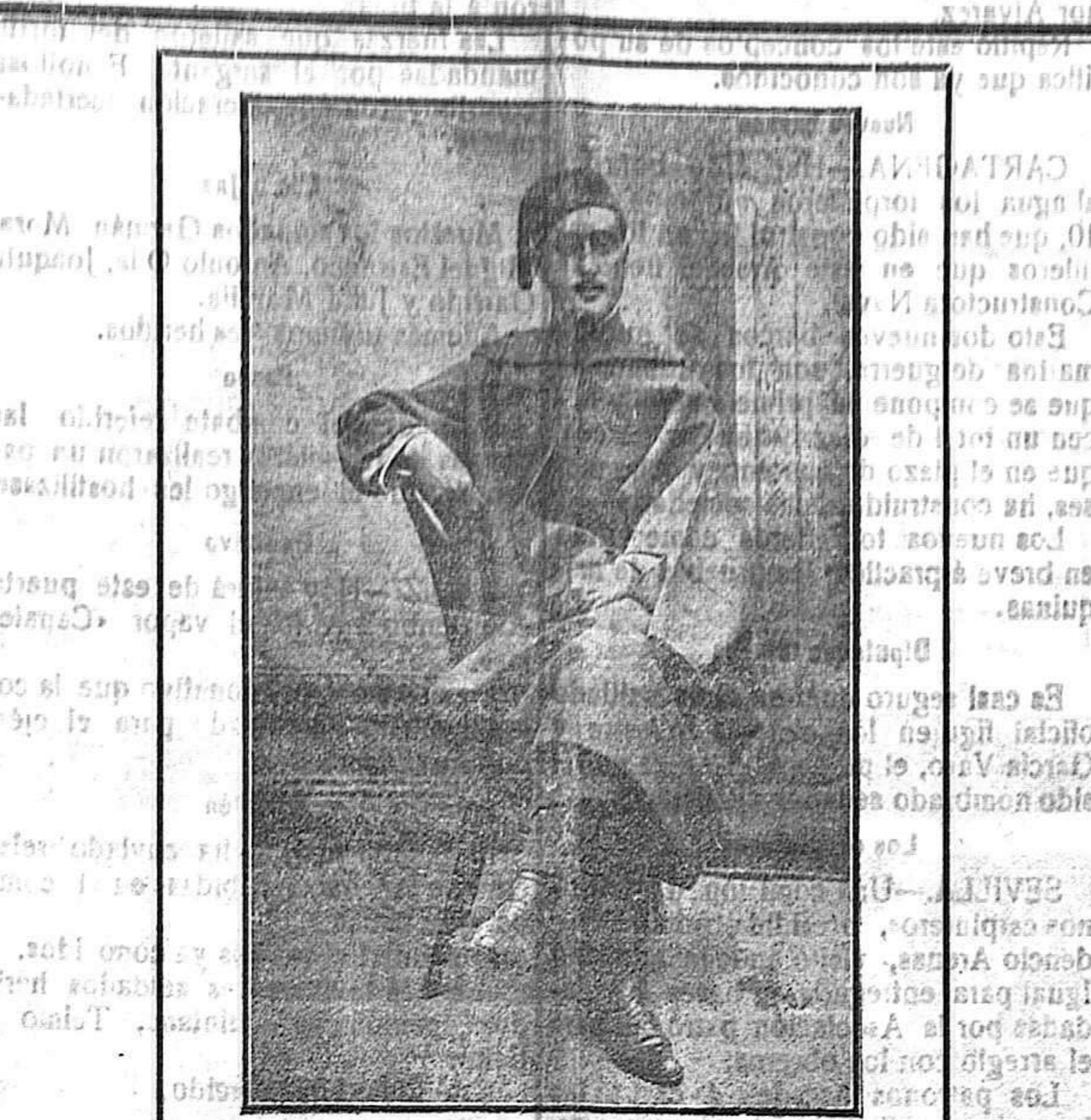
Los manchegos en la guerra

la muerte me rosó el rostro; luego me besó en las sienes, se me adentró en la sangre y hasta llegó á sentirlo en la médula. Creí morir de terror. Los ojos del muerto me miraban, dilatadas sus pupilas, como si fueran á salirse de las órbitas. Fueron terribles aquellos instantes. Abrizado al juicio me imaginé que sus dientes, desdentados las mandíbulas por una muela de espanto, se hincaban en mis carnes, desgarrándolas. Permanecí inmóvil no sé cuantos tiempo, como si me hubiera muerto también. Recuerdo que las ideas se amantaban en el cerebro golpeándose. «Levántate», me decían, y yo quieto, sin obedecer los músculos, quedé en tensión. Al fin me estremecí y pude enderezarme; se me había manchado de sangre y de fango la ropa. Pensé que en tal estado corría grave riesgo de ser detenido por las autoridades de la ciudad. —¿Y no encontrastes á Raimundo Berges? preguntó uno de los oyentes. —Lo encontré poco después—respondió el alcoholizado moro. —¿Cómo? —Ahora lo diré si nadie me interrumpe. Restablecido el silencio, prosiguió la interesante narración: —Me volví á casa del moro rico á cambiar de