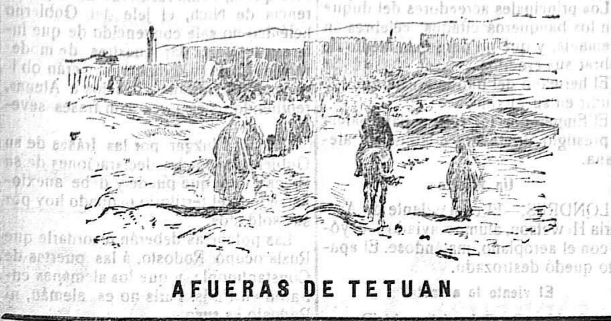
AFUERAS DE TETUAN

Cercos, cuatro, seis, ocho, personas desconocidas que nos miran, otros tantos chiquillos que examinan nuestra indumentaria, el equipaje, los bolsos de viaje... ¡Oh, si ellos cataran alguna de las chucherías que contienen!