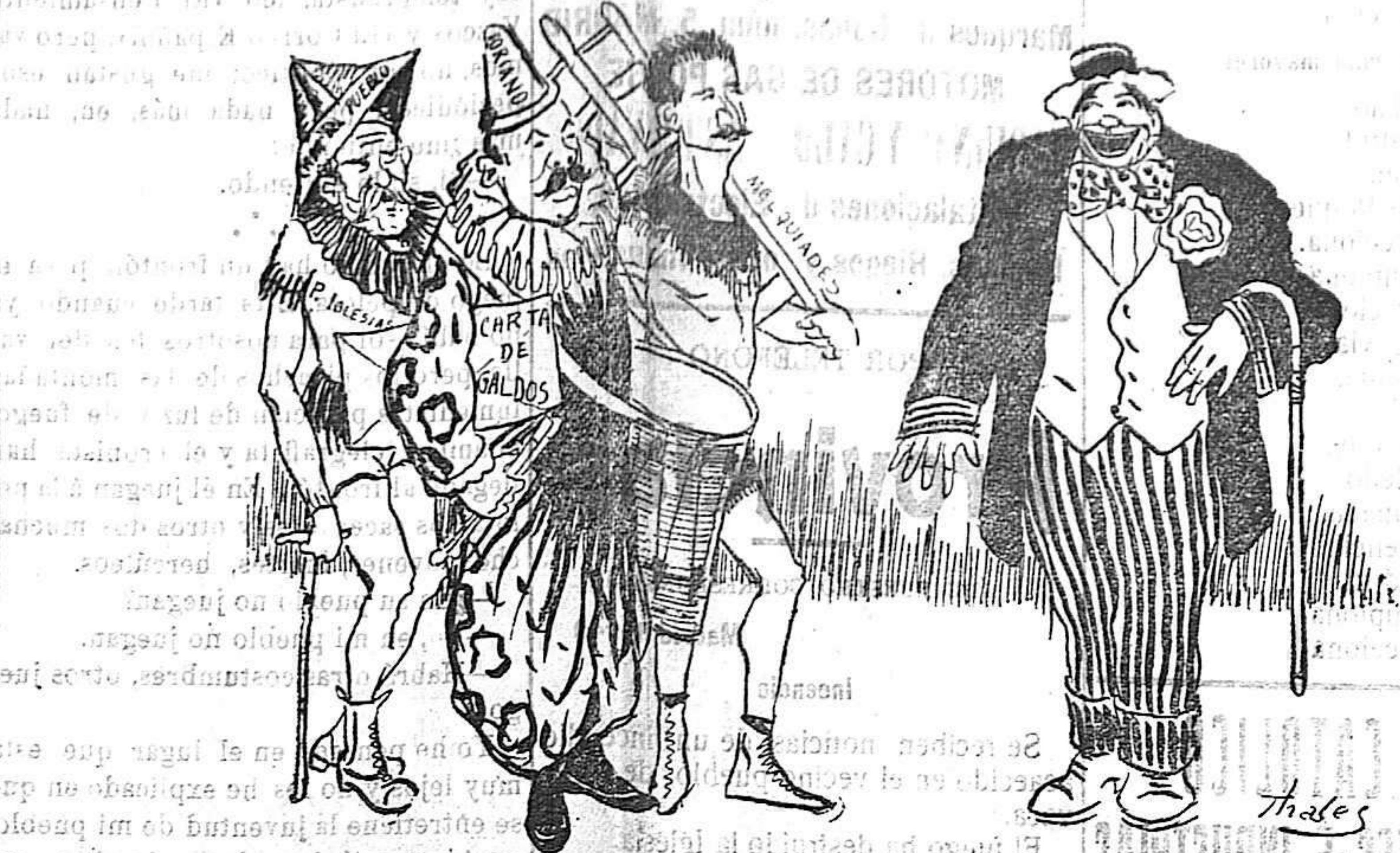
GEDEÓN.—Tengo el gusto de presentaros á la nueva compañía de títeres que hará una tournée por provincias.

Rogamos á nuestros suscriptores, que al cuant nota alguna deficiencia ó retraso en el recibo del periódico, pasen aviso á nuestras oficinas para subsanar lo con toda prontitud.