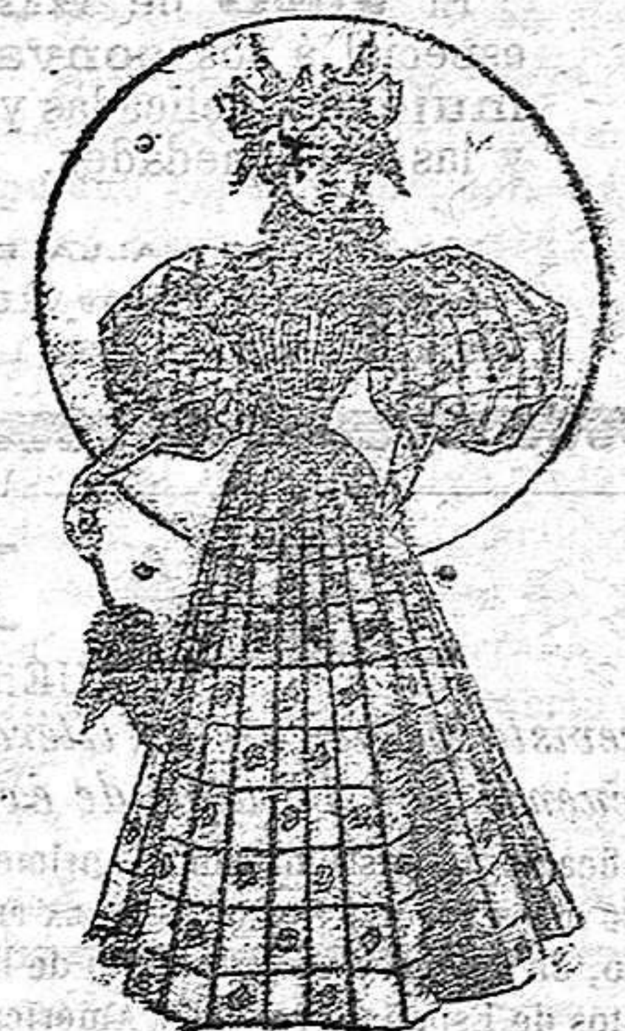
Traje de calle

De seda brochada; cuerpo flojo de encaje, recogido en la cintura por un cinturón de cinta; en los hombros dos volantes de encaje sujetos por dos lazos del mismo género que el cinturón; mangas cortas de raso, y falda—forma campana—con una tabla en el delantero, terminando en el cuello, y sujeta por un lazo de cinta.