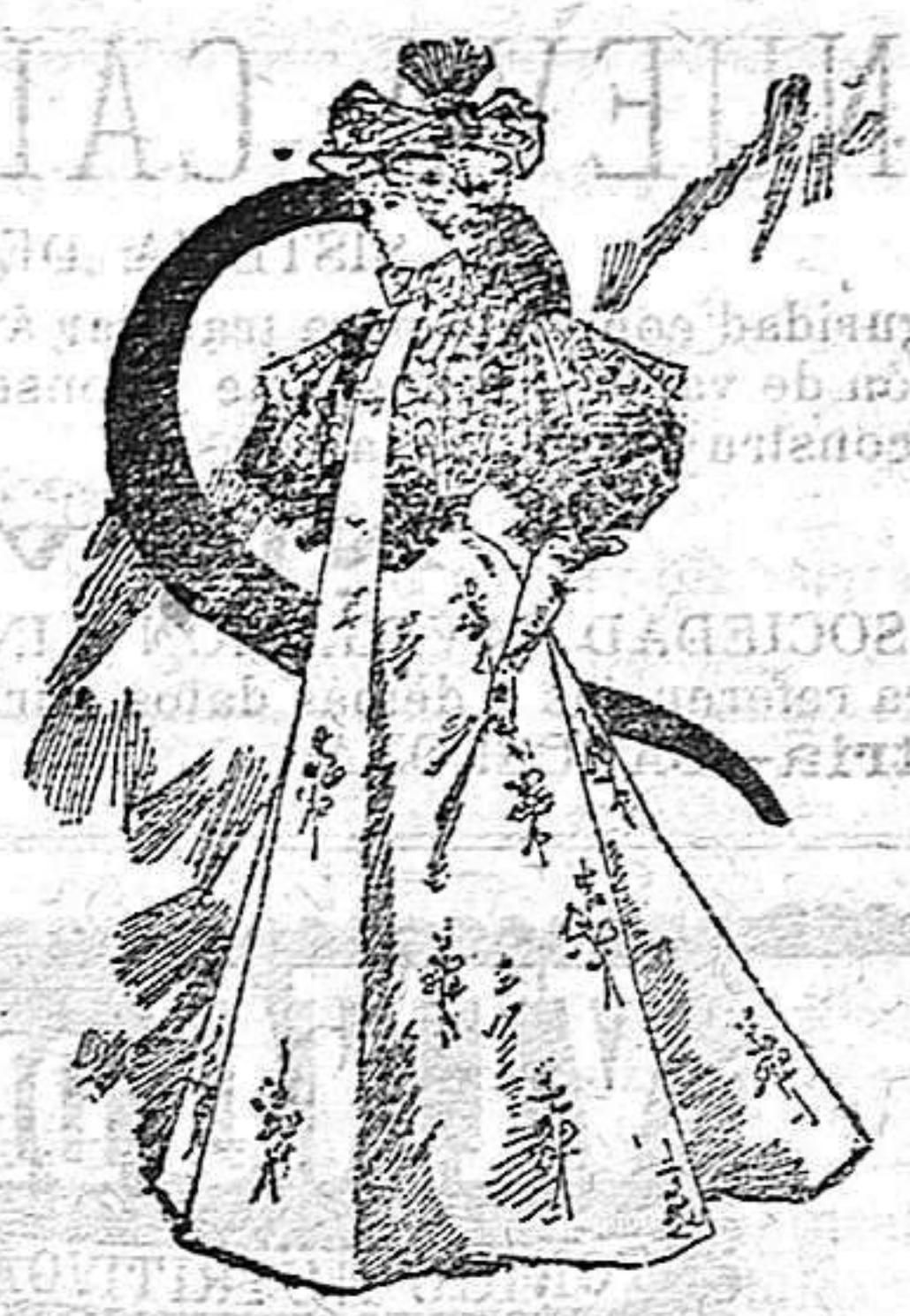
Traje de ceremonia

Traje de paseo De surah liso; cuerpo flojo y recogido en el delantero con un nudo del mismo género; cuello de encaje quipar formando picos; mangas al bies; cinturón de encaje, y falda en forma de campana.