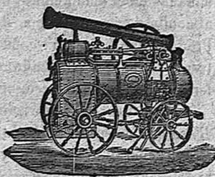
Máquina de va por

SUCURSAL EN VALLADOLID Acera de Recoletos, n i n