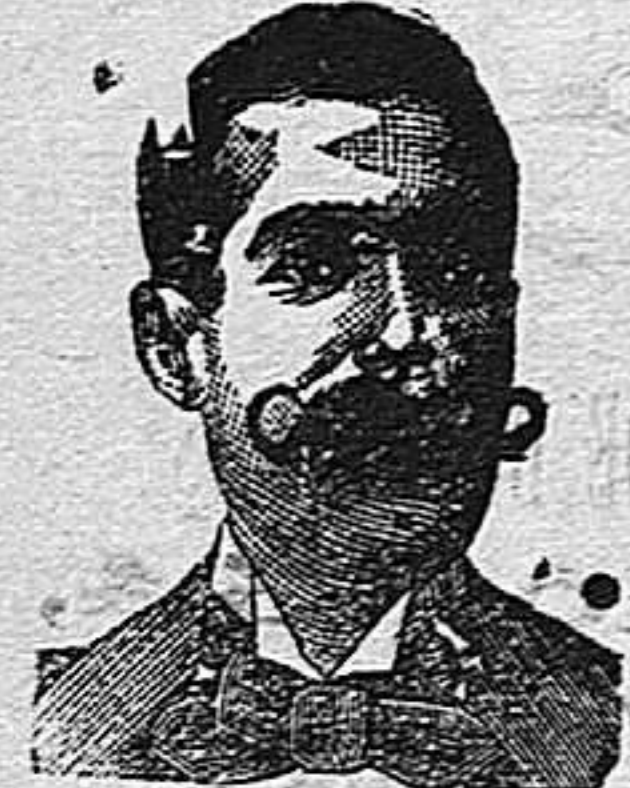
A. Sallusti Costanzo Diputación, 435, Barcelona