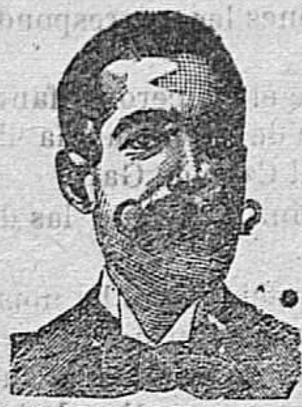
A. Sarvat Costanzi Diputación, 435, Barcelona

Calle de la Unión, número 38.—TARRAGONA Variado y económico surtido de gorras y sombreros de todas clases 38, Unión, 38