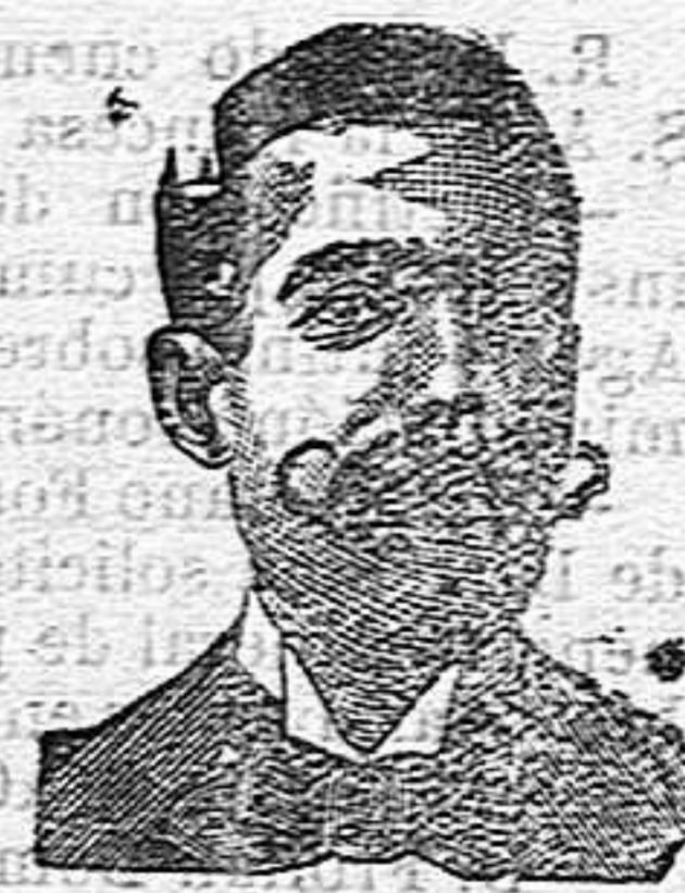
A. Salvati Costanzi Diputación, 435, Barcelona.

Establecimiento tipográfico DE LLORENS, GIBERT Y CABRÉ CALLE FORTUNY, 4 En este antiguo y acreditado establecimiento se confeccionan toda clase de trabajos tipográficos por difíciles que sean.