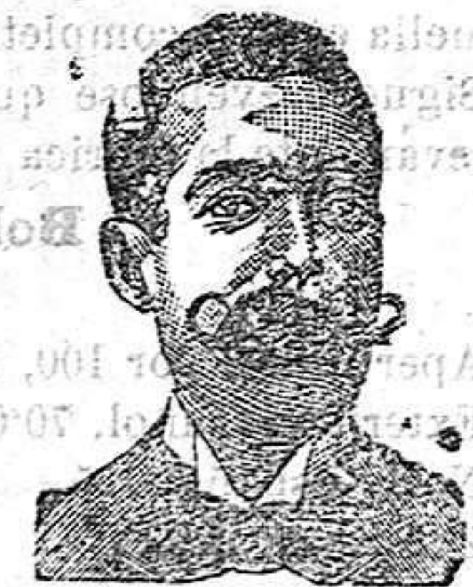
A. Salvati Costanzi Diputación, 435, Barcelona

SE SIRVE A DOMICILIO Cerveza DAMM y MORITZ en botellas de varios tamaños