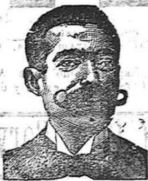
A. Salvati Costanzi Diputación, 435, Barcelona

ESQUELAS Se reciben en la im- prenta de este periodi- co hasta la una de la mañana.