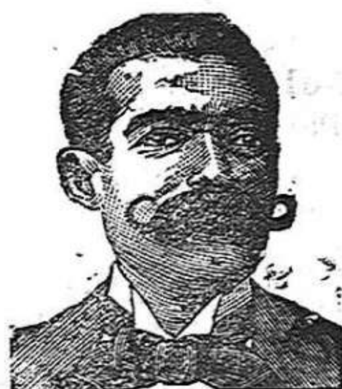
A. Salvati Costanzi Diputación, 435, Barcelona

ESQUELAS Se reciben en la imprenta de este periódico hasta la una de la madrugada.