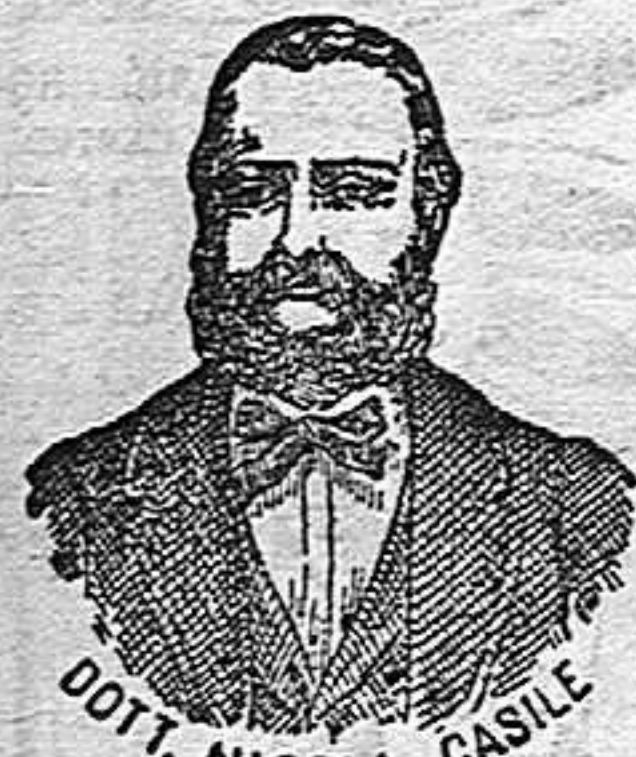
Dr. Casile, inventor de los renombrados medicamentos CASILE. Diputación, 435 BARCELONA

han logrado que el Dr. Casile de Nápoles descubriera los milagrosos medicamentos que curan infaliblemente la tisis en cualquiera de sus períodos y todas las enfermedades del estómago. A la más pequeña manifestación de un resfriado, tos, catarro, bronquitis, gripe, asma (sofocación), espectoración y de cualquier enfermedad del pecho, tomar inmediatamente las PERLAS CASILE, que no sólo curan infaliblemente estas enfermedades, sino que se tendrá la completa seguridad de no contraer otras mucho más graves. Siguiendo este método se podrá decir uo más tisis.