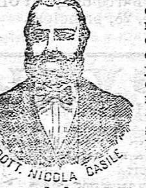
INVENTOR DE LOS RENOMBRADOS MEDICAMENTOS CASILE.

Precios de venta: Perlas Casile, 5 ptas., Confites Casile, 5 ptas., Bálamo Casile, 5 ptas. De venta en las acreditadas farmacias y en casa del inventor, Diputación 435, Barcelona. En Tarragona D. M. Font, Rambla San Jaaz, 57.