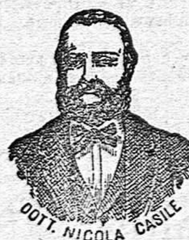
Dr. Casile Inventor de los renombrados medicamentos CASILE. Diputación, 349 BARCELONA

han logrado que el Dr. Casile de Nápoles descubriera los milagrosos medicamentos que curan infaliblemente la tisis en cualquiera de sus períodos y todas las enfermedades del estómago. A la más pequeña manifestación de un resfriado, tos, catarro, bronquitis, gripe, asma (sofoación), espectoración y de cualquier enfermedad del pecho, tomar inmediatamente las PERLAS CASILE, que no sólo curan infaliblemente estas enfermedades, sino que se tendrá la completa seguridad de no contraer otras mucho más graves. Siguiendo este método podrá decirse no más tisis.