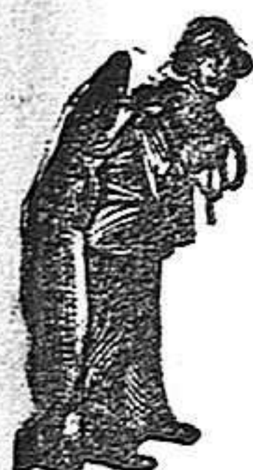
¡Obténase siempre la Emulsión con esta marca "El Pescador" marca del procedimiento Scott!

el dolor y la fatiga y le llena a uno de vigor y bienestar, como la Emulsión SCOTT.