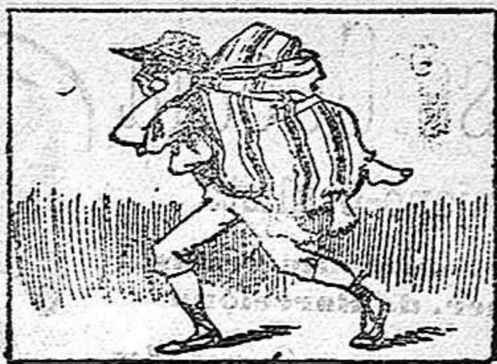
La solución en el próximo número.

Solución á la Charada en acción anterior NUMEROSAS.