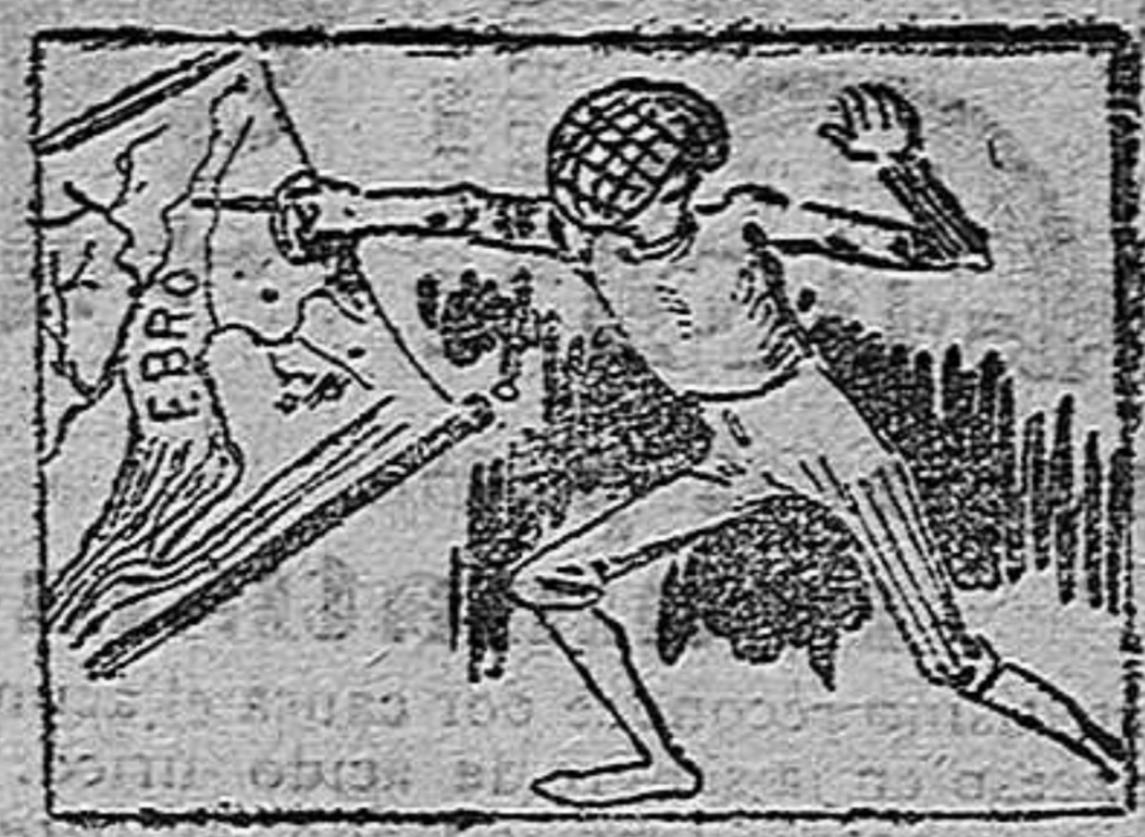
La solución en el próximo número.

Solución a la Charada en acción CANTEROS.