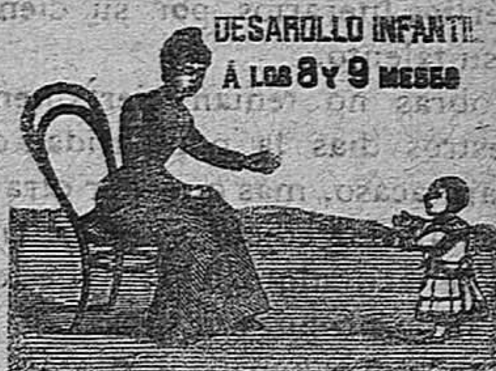
DESARROLLO INFANTIL A LOS 8 Y 9 MESES