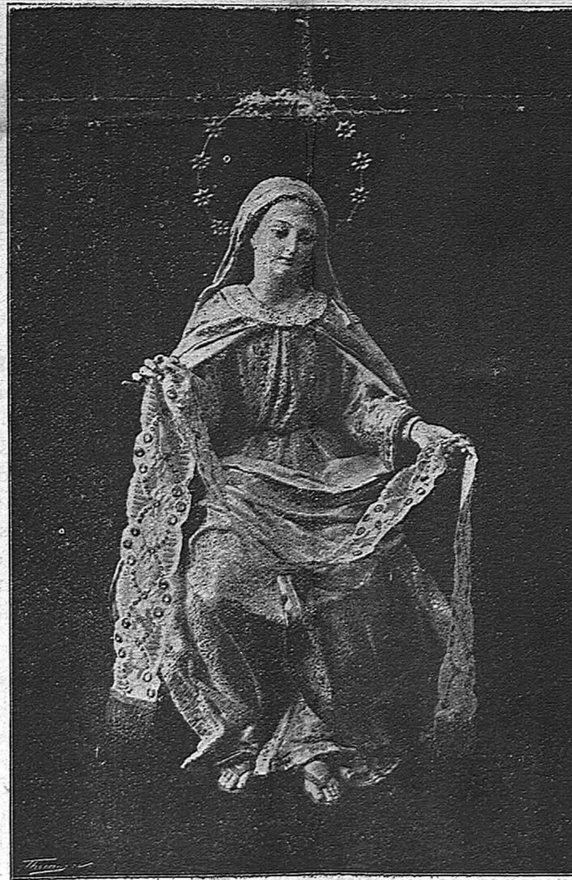
Nuestra Señora de la Cinta

“Soberana y Señora Nuestra; Virgen y Madre idolatrada: á Tus pies se postra hoy un pueblo que entre sus más brillantes y hon-