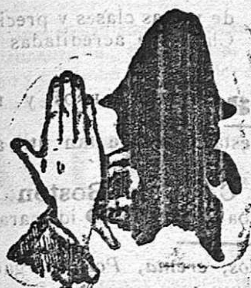
(La solución en el número próximo.)